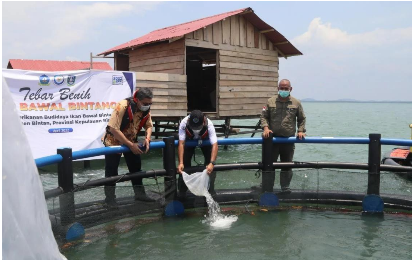
Kampung Perikanan Budi Daya - KKP

Badan Penyuluhan dan Pengembangan Sumber Daya Manusia Kelautan dan Perikanan (BPPSDM) bertanggung jawab dalam pelaksanaan program ini. Hingga saat ini, banyak kemajuan signifikan telah dicapai melalui inisiatif Desa Perikanan Modern.