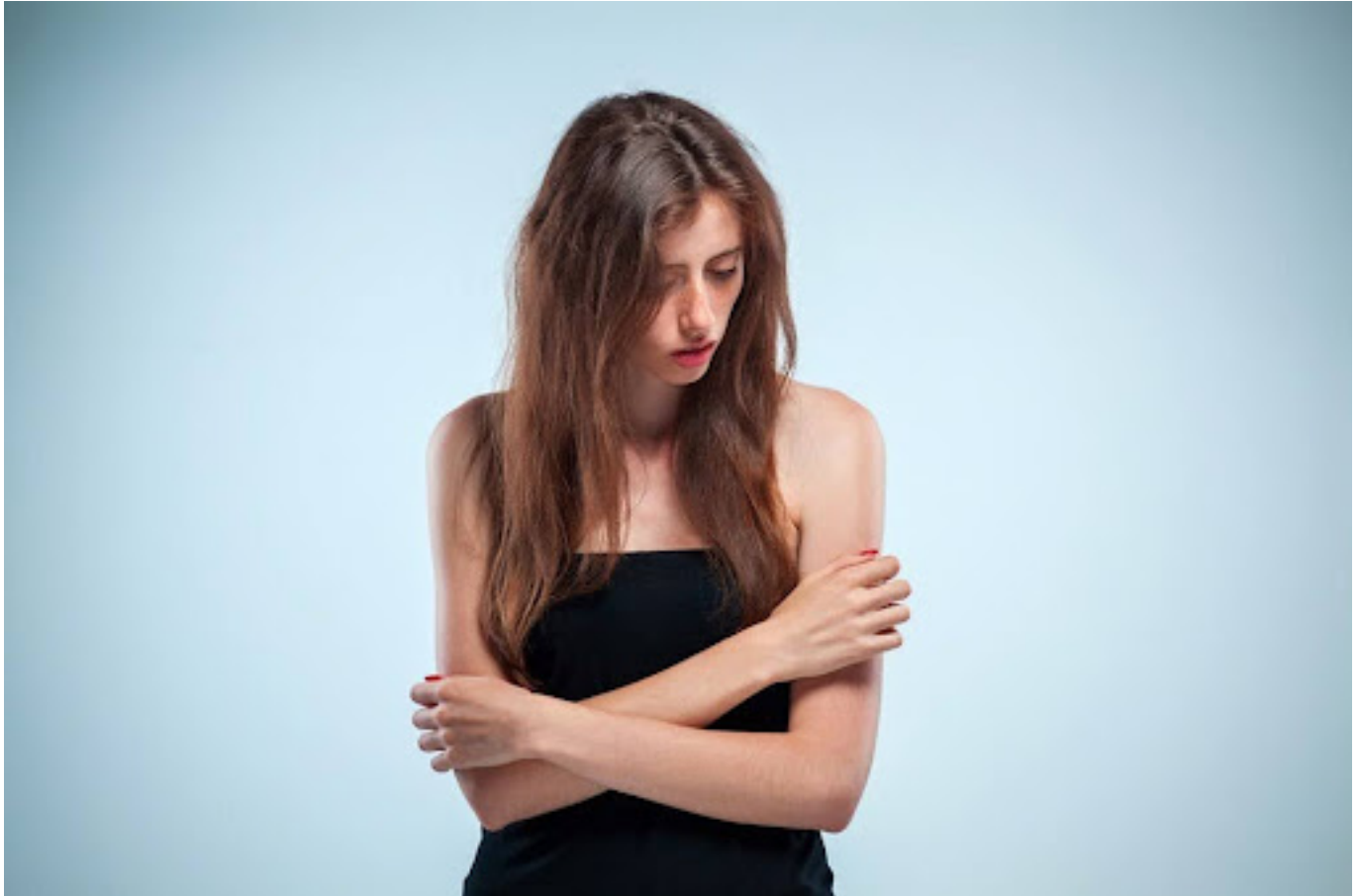
Ilustrasi wanita yang merasa rendah diri

Komentar atau perlakuan negatif terhadap penampilan seseorang memiliki potensi untuk merusak harga diri dan rasa percaya diri individu tersebut.