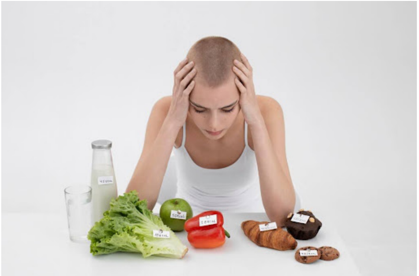
Ilustrasi wanita yang stres dengan dietnya

Body shaming dapat menjadi pemicu perilaku makan yang tidak sehat, seperti anoreksia atau bulimia, karena individu mungkin merasa tertekan untuk mencapai standar kecantikan yang tidak realistis.