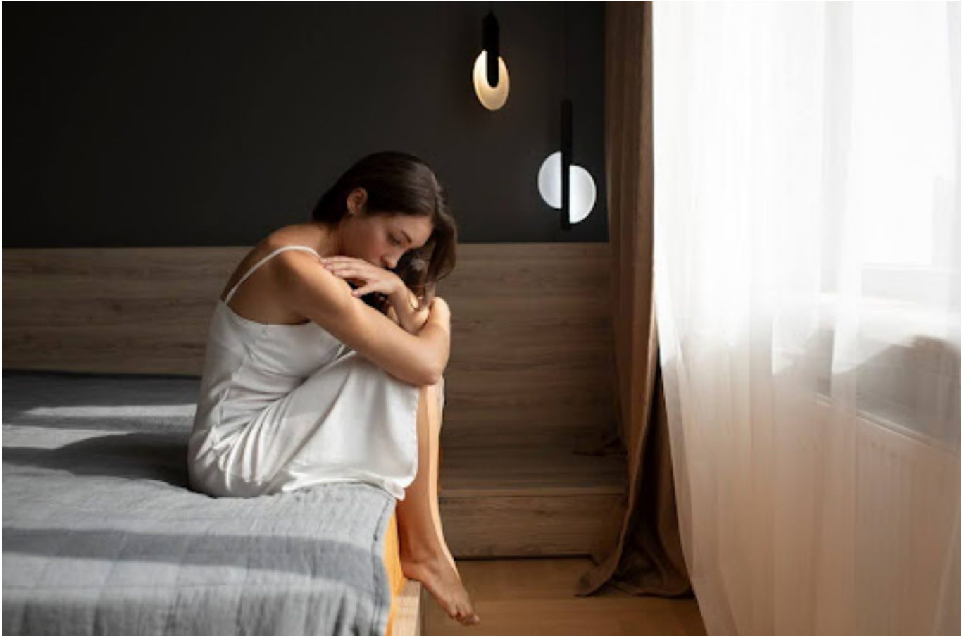
Ilustrasi wanita yang menyendiri di kamar

Seseorang yang menjadi korban body shaming cenderung mengalami dampak psikologis yang parah, termasuk menghindari interaksi sosial dan merasa terisolasi.