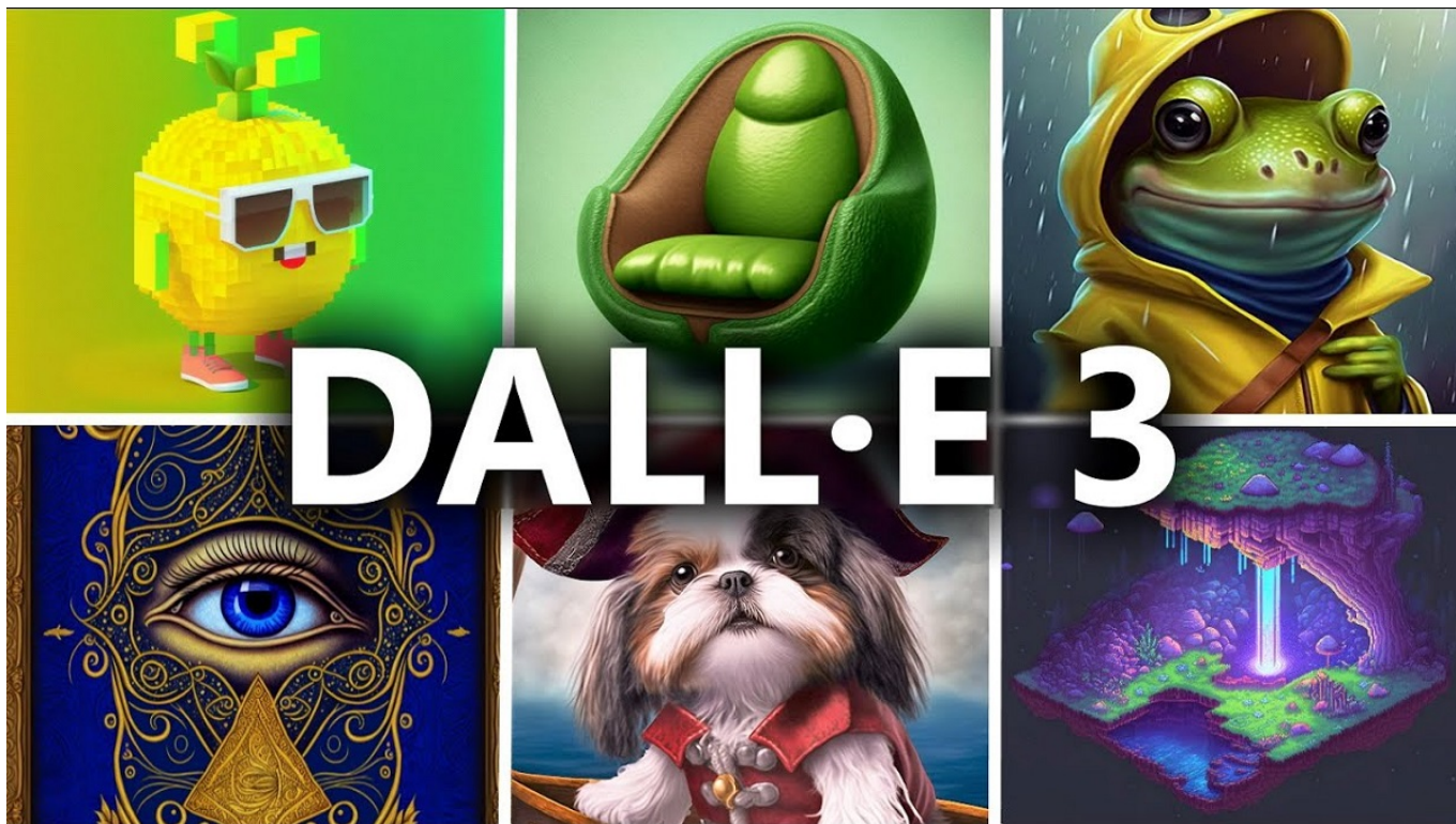
DALL-E 3 - shotkit

DALL-E 3 saat ini dalam uji beta, tetapi OpenAI berencana untuk membuatnya tersedia untuk umum dalam waktu dekat.