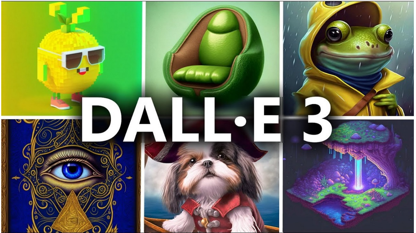
DALL-E 3 - shotkit

DALL-E 3 saat ini dalam uji beta, tetapi OpenAI berencana untuk membuatnya tersedia untuk umum dalam waktu dekat.