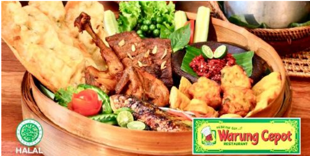
Instagram Warung Cepot

Ingin makan kuliner Sunda dengan porsi besar? Warung Cepot bisa menjadi pilihan spot kuliner Sunda yang pas untuk Anda tuju. Di sini, Anda akan disuguhkan dengan berbagai santapan khas Tanah Pasundan yang tidak hanya mantap di lidah, tapi juga cantik dipandang mata.