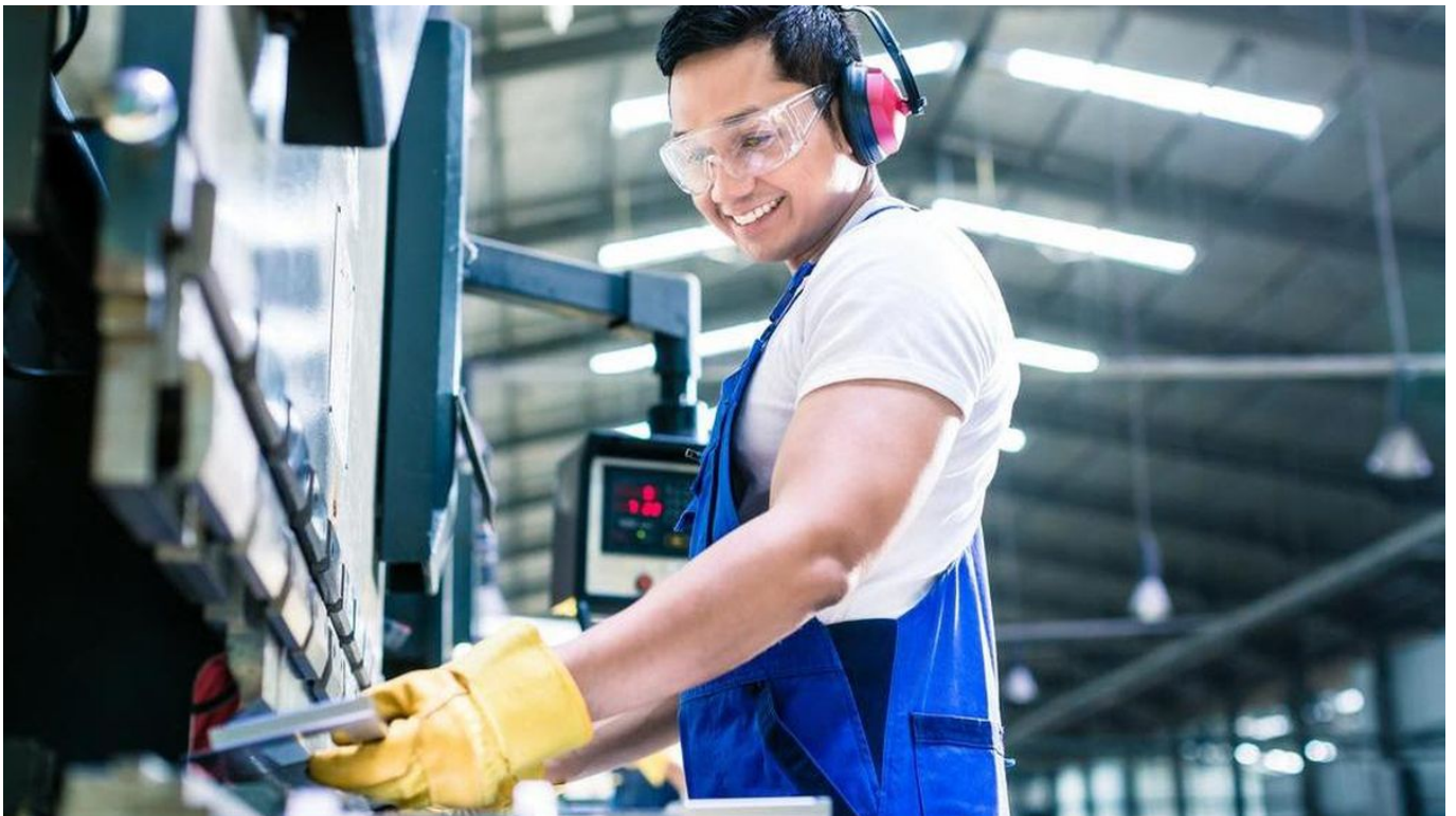
Ilustrasi manufaktur Indonesia - detik

Baca Juga: Ekonomi Tumbuh di Atas 5 Persen, Farhan: Fiskal Bandung Sangat Sehat