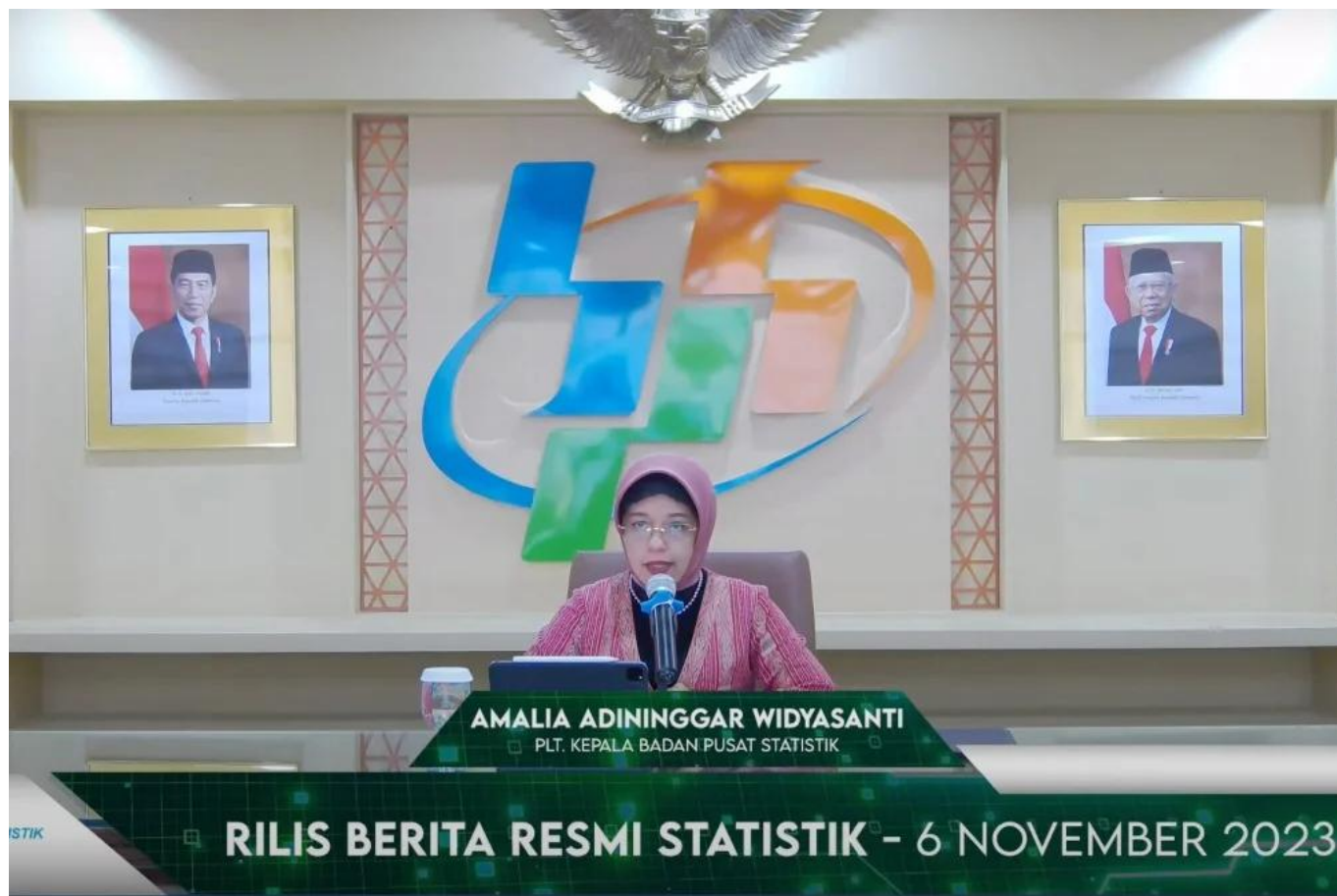
Amalia Adininggar Widyasanti dalam rilis Badan Pusat Statistik, Senin (6/11/2023)

Angka ini menunjukkan penurunan dibandingkan dengan periode yang sama tahun sebelumnya yang mencapai 5,73% dan juga berkurang dibandingkan dengan pertumbuhan pada kuartal sebelumnya sebesar 5,17% (yoy).