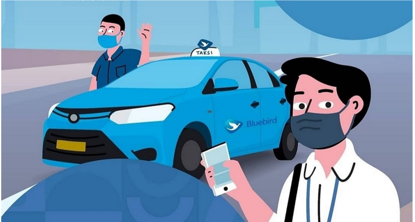
Ilustrasi - indotel