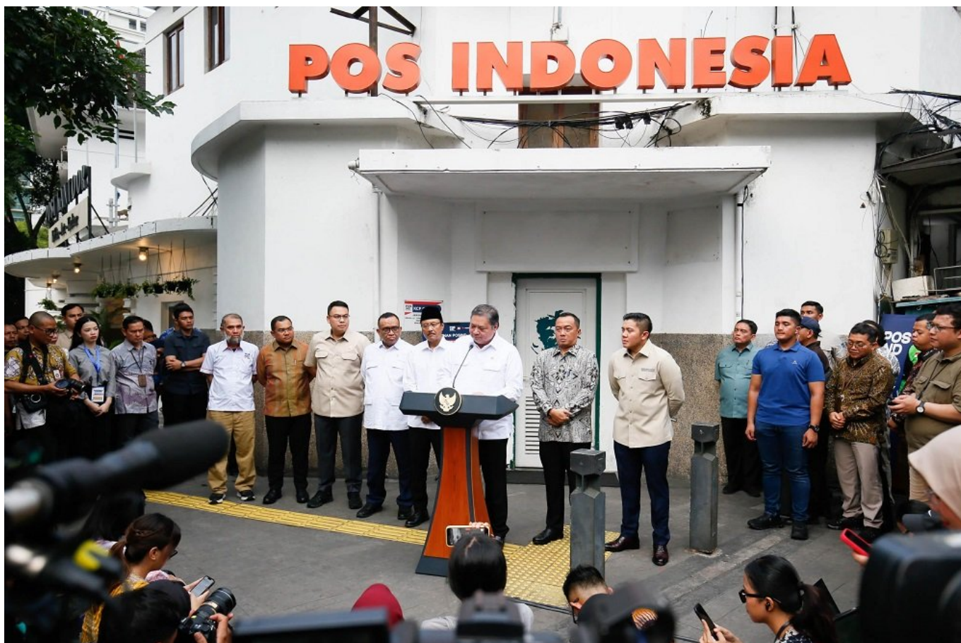
Menteri Koordinator Bidang Perekonomian Airlangga Hartarto (Okezone).

“Jumlah ini lebih tinggi sebelumnya, dan ini bisa menjangkau 104 juta orang, kalau asumsi 1 KPM ada ayah, ibu, dan dua orang anak,” kata Menteri Koordinator Perekonomian Airlangga Hartarto saat penyaluran BLTS Kesra di Kantor Pos Cikini, Jakarta, dikutip dari CNN.