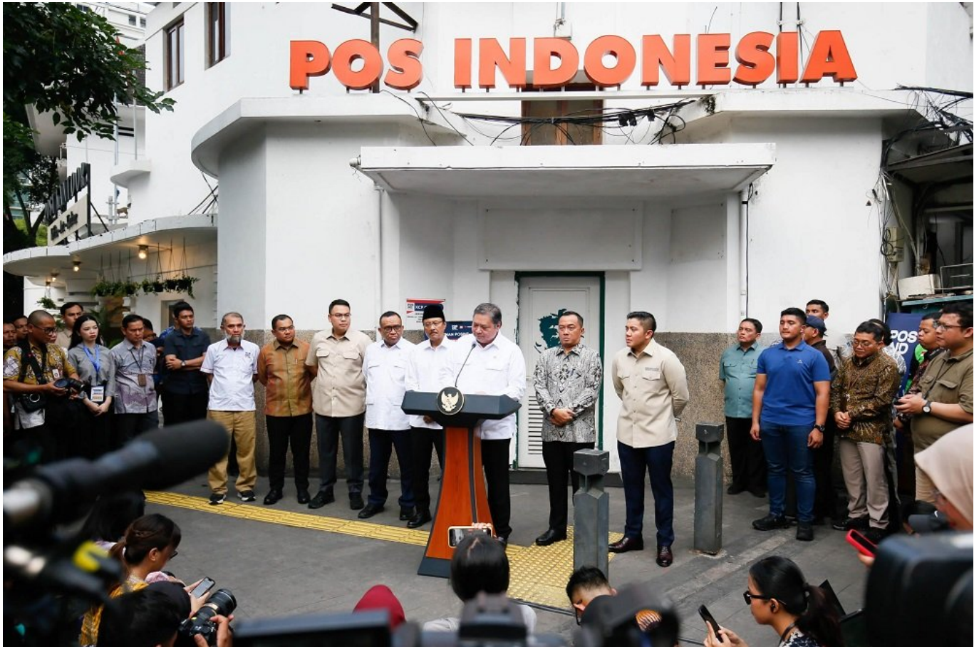
Menteri Koordinator Bidang Perekonomian Airlangga Hartarto.