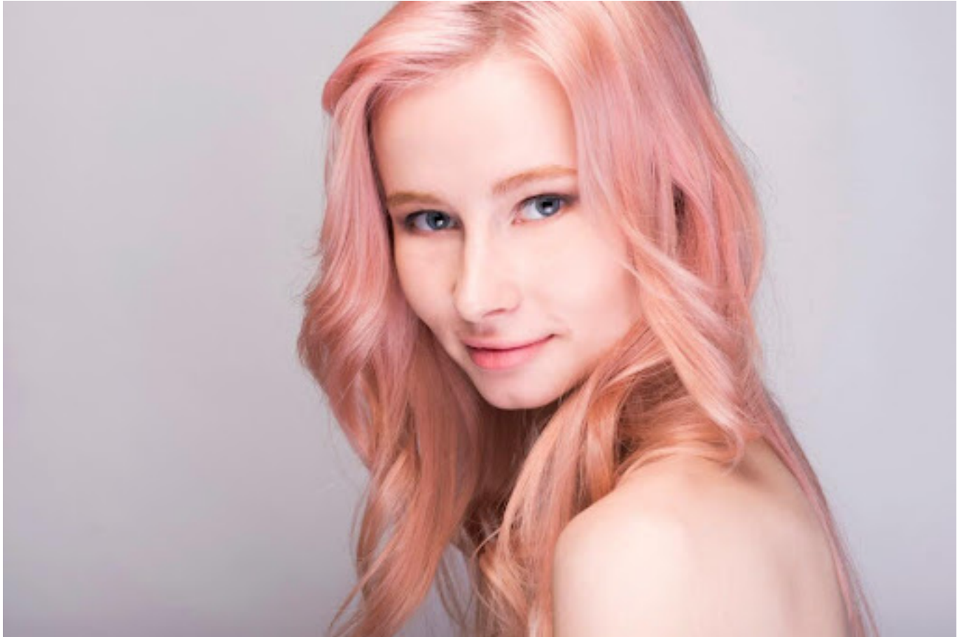
ilustrasi rambut yang telah diwarnai

Bleaching rambut menawarkan banyak keuntungan bagi mereka yang ingin mengubah penampilan dan mengekspresikan gaya pribadi. Berikut beberapa manfaatnya: