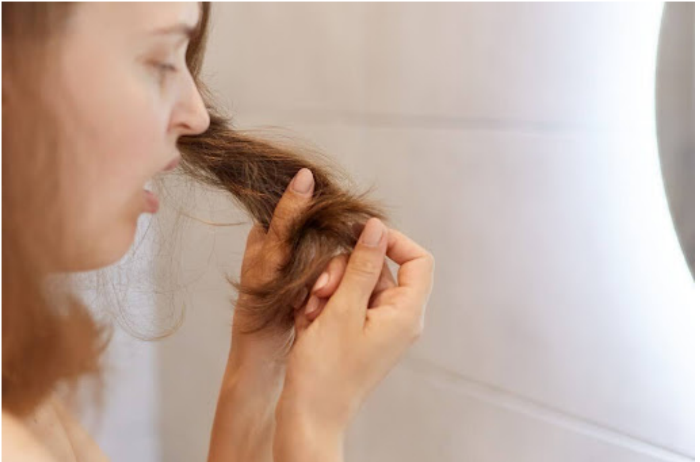
ilustrasi wanita yang rambutnya rusak

Meski memiliki banyak kelebihan, bleaching rambut juga datang dengan beberapa efek samping yang perlu diwaspadai. Berikut adalah beberapa efek samping bleaching rambut: