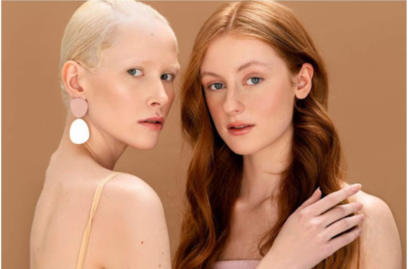
ilustrasi wanita yang berbeda warna rambut

Bleaching rambut memang bisa memberikan hasil yang menakjubkan, tapi penting untuk diingat bahwa ada resikonya juga. Pastikan kamu mempertimbangkan dengan matang sebelum memutuskan untuk bleaching rambut.