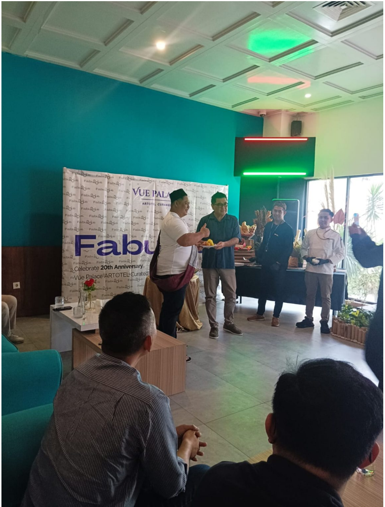
Meriah Anniversary VUE Palace ARTOTEL CURATED