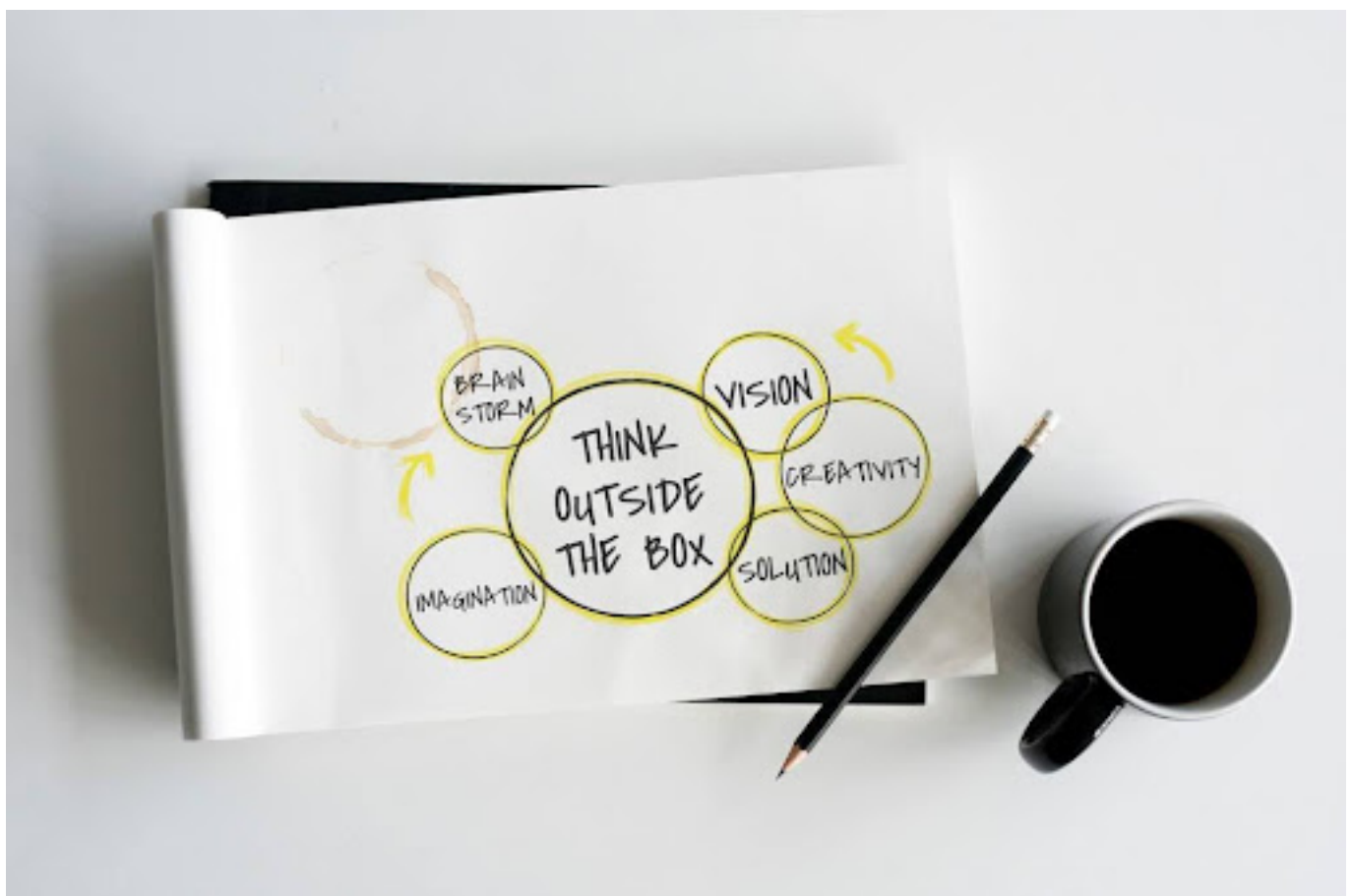
Ilustrasi pemetaan pikiran

Mind map adalah sebuah teknik untuk memetakan pikiran dan ide dengan cara visual. Teknik