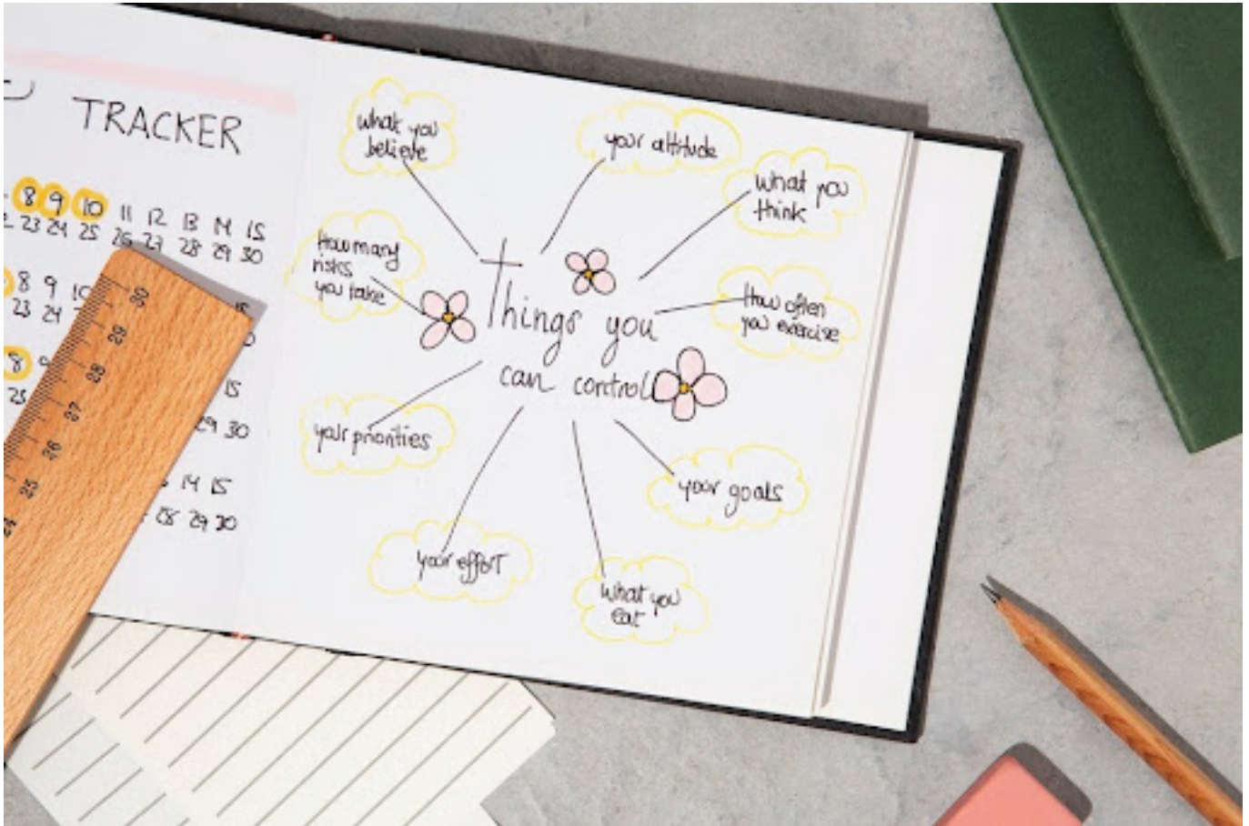
Ilustrasi pemetaan pikiran