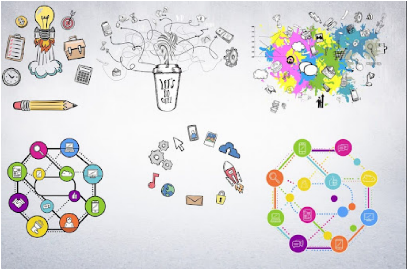
Ilustrasi pemetaan pikiran

Pemetaan pikiran bisa menjadi alat yang sangat berguna untuk mengorganisir ide-ide dan informasi, serta merangsang kreativitas dalam pemecahan masalah.