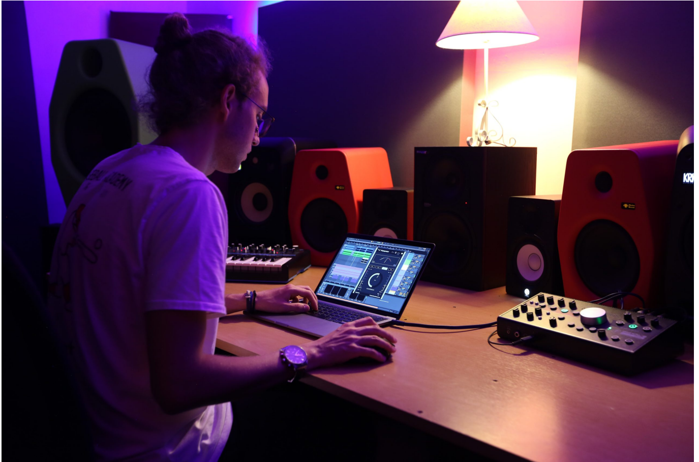
Ilustrasi seorang produser bikin musik

Jadi, apakah AI bakal menggantikan musisi manusia? Nggak juga! Tapi yang jelas, AI bisa jadi partner kreatif yang mempermudah hidup kamu, terutama dalam urusan bikin musik.