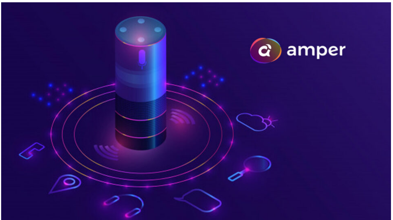
Ilustrasi amper music

Lagi ngejar deadline tapi tetap butuh musik yang catchy? Amper Music hadir buat kamu yang nggak mau ribet tapi butuh hasil cepat dan berkualitas.