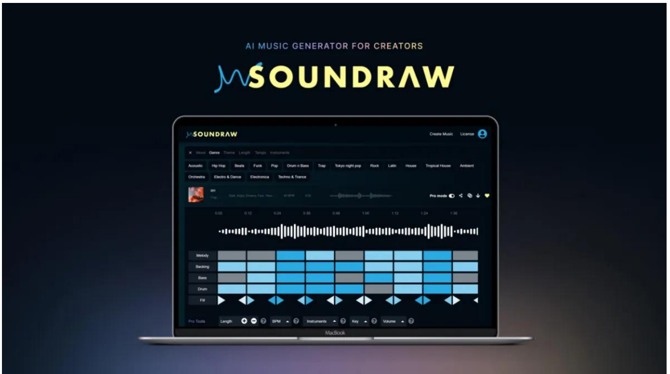
Soundraw - ist

Punya selera musik yang spesifik dan pengen kontrol penuh atas musik yang kamu buat? Soundraw bisa jadi pilihan terbaik buat kamu.