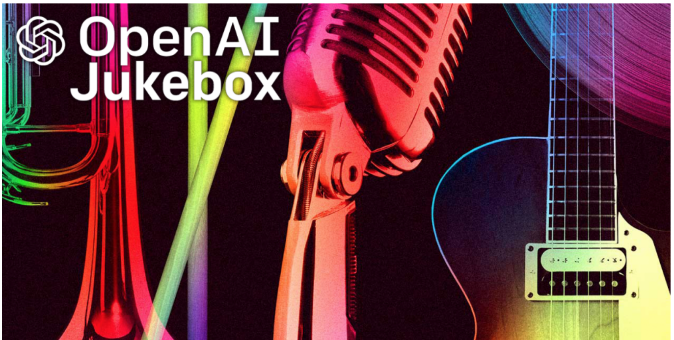
OpenAI Jukebox - medium

Ini nih, AI yang bakal bikin kamu kaget dengan kemampuannya! OpenAI Jukebox bisa bikin musik lengkap dengan vokal dan lirik, bahkan meniru gaya artis tertentu.