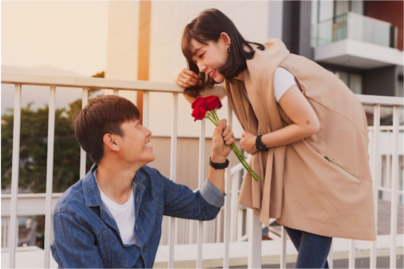
Ilustrasi PDKT

Ingat, PDKT itu butuh proses. Jangan terlalu memaksakan diri dan nikmati setiap momennya. Yang terpenting adalah menjadi diri sendiri dan menunjukkan ketulusan hati.