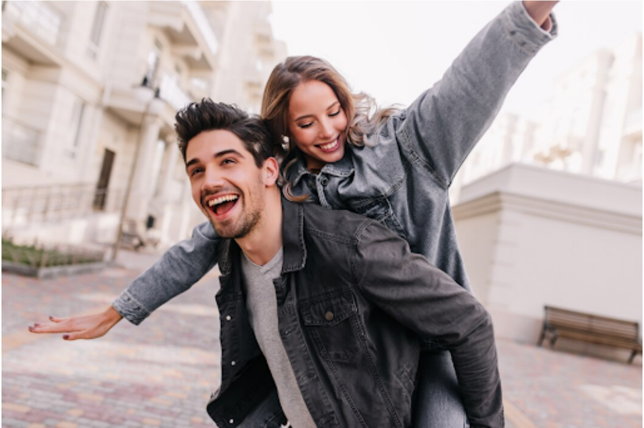
Ilustrasi pasangan