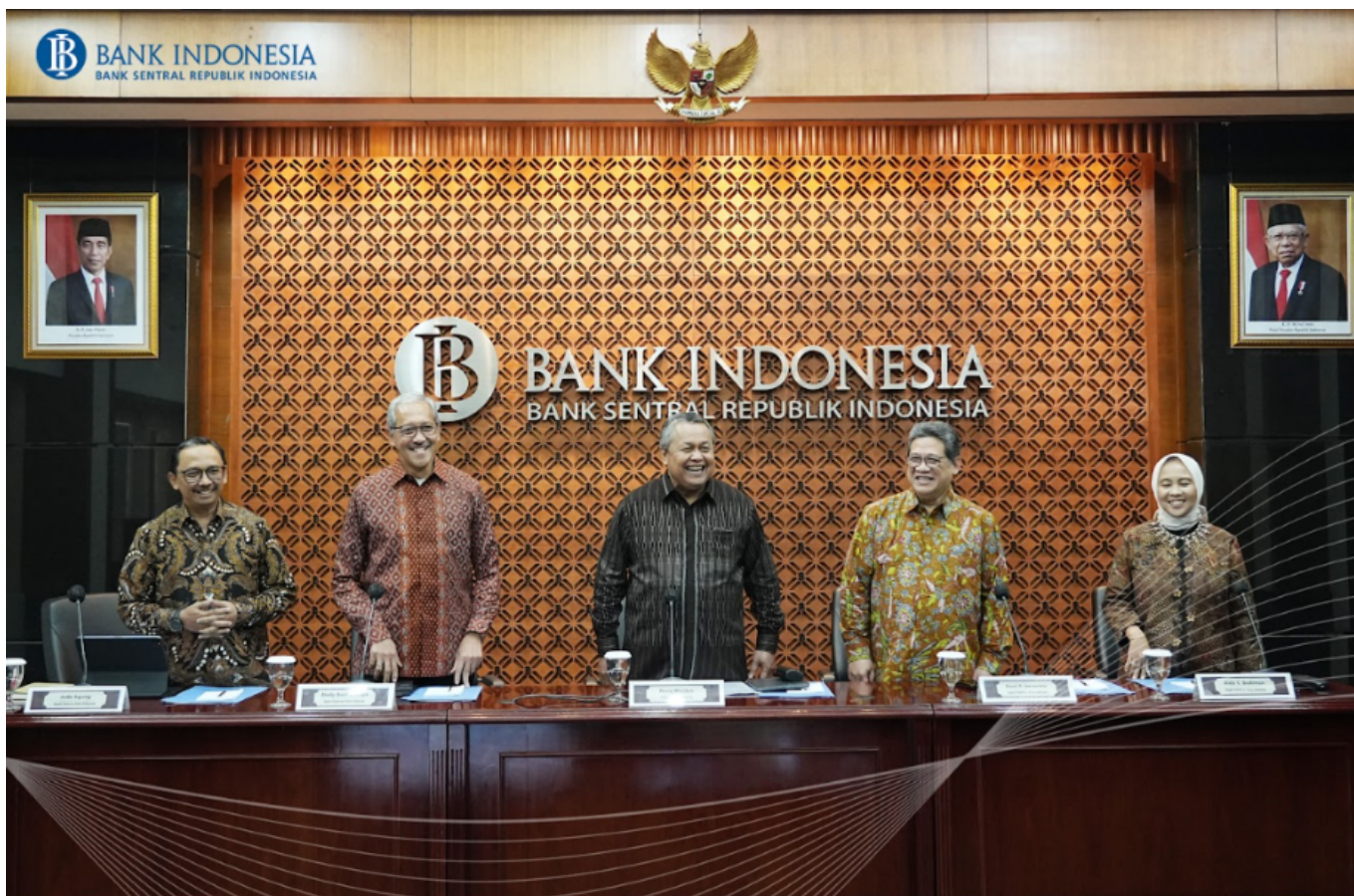
Rapat Dewan Gubernur (RDG) dengan putusan menaikkan BI 7-Day Reverse Repo Rate - Bank Indonesia

Kenaikan suku bunga ini diambil sebagai langkah pencegahan untuk melindungi nilai tukar Rupiah dari tekanan global yang semakin meningkat.