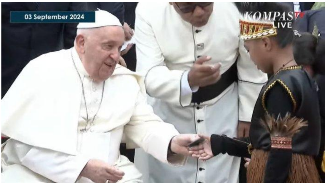
Tangkapan layar youtube Kompas TV