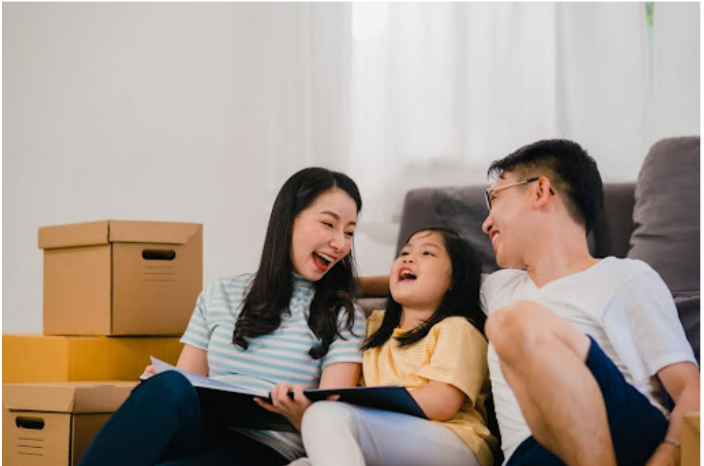
Ilustrasi bercengkrama bersama keluarga

Membiasakan anak untuk mengucapkan empat kata ajaib ini—tolong, maaf, terima kasih, dan permisi—akan membantu mereka tumbuh sebagai pribadi yang berkarakter, menghargai orang lain, dan mampu berkomunikasi dengan baik.