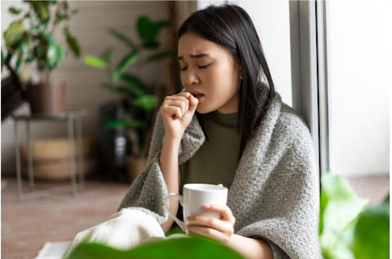
Ilustrasi wanita yang batuk sambil memegang cangkir

Meskipun batuk disertai dahak ini adalah hal yang umum, Kamu perlu ke dokter jika mengalami hal-hal berikut: