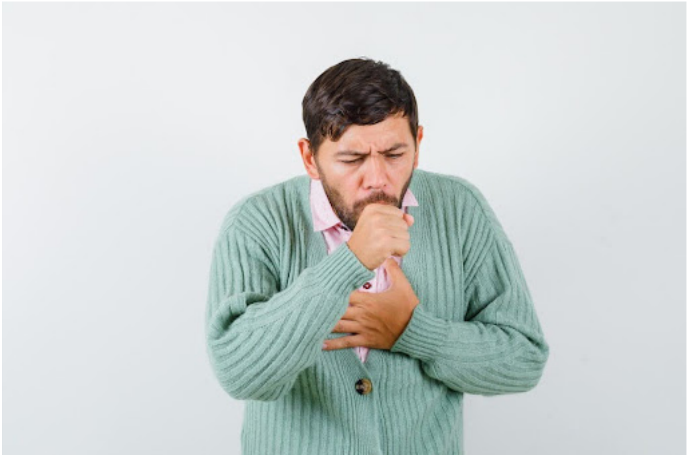
Ilustrasi pria yang terbatuk dan memegang dada - Freepik

Gejala utama batuk disertai dahak adalah batuk yang disertai dengan lendir. Lendir ini dapat berwarna bening, kuning, hijau, atau bahkan mengandung darah. Warna dahak dapat menjadi indikasi penyebab batuk berdahak: