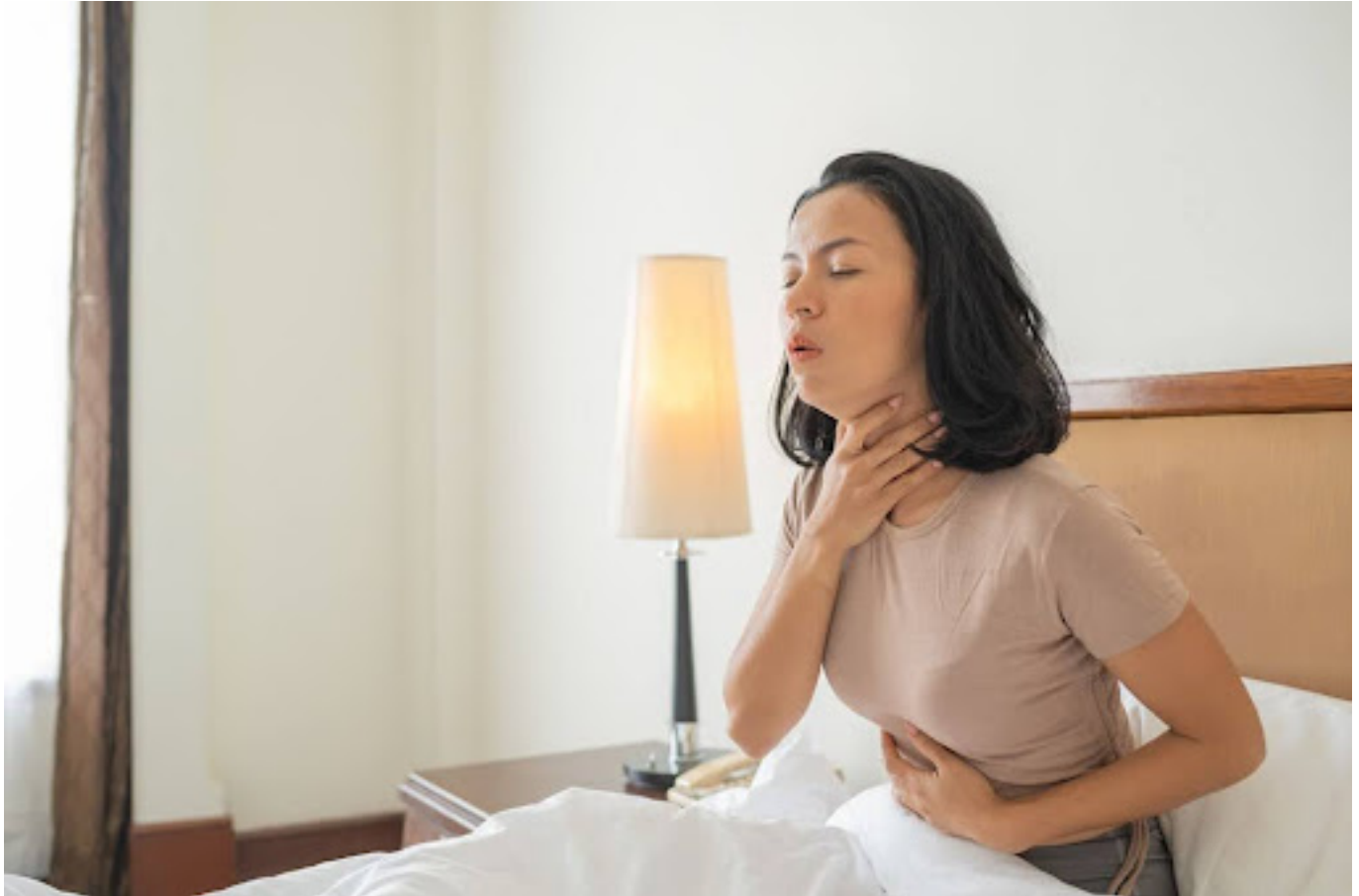
Ilustrasi wanita yang batuk

Selain infeksi, beberapa kondisi lain juga dapat menyebabkan batuk disertai dahak, seperti: