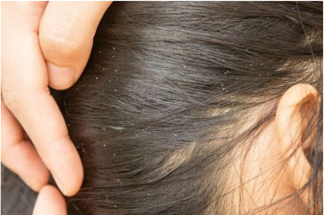
ilustrasi rambut dengan telur kutu - pinterest

Jika ada anggota rumah tangga yang terinfeksi kutu rambut, lakukan langkah-langkah berikut: