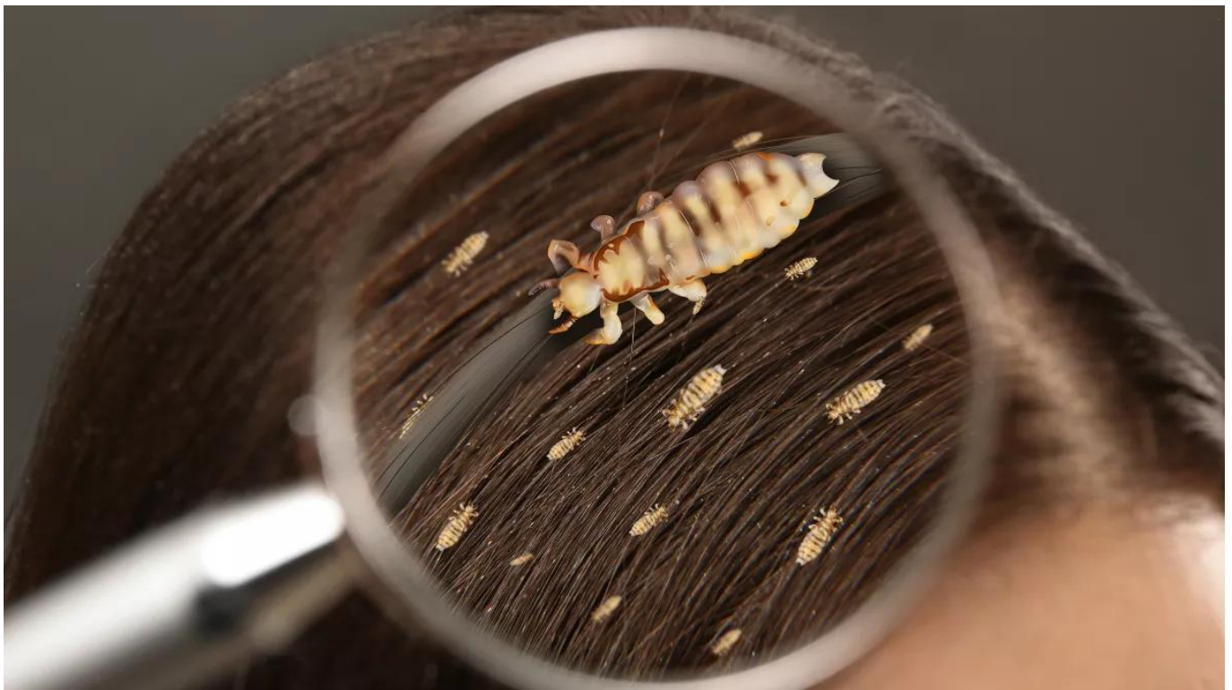
Ilustrasi kutu di rambut

Mencegah kutu lebih mudah daripada mengobatinya. Berikut beberapa tips yang bisa kamu lakukan: