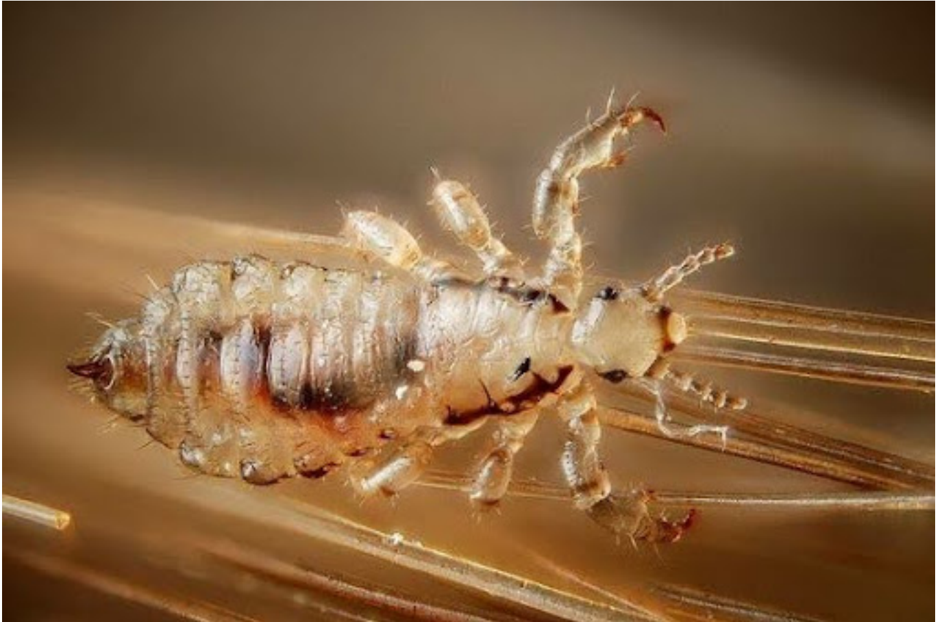
Ilustrasi kutu rambut

Beberapa cara efektif untuk membasmi kutu ialah sebagai berikut: