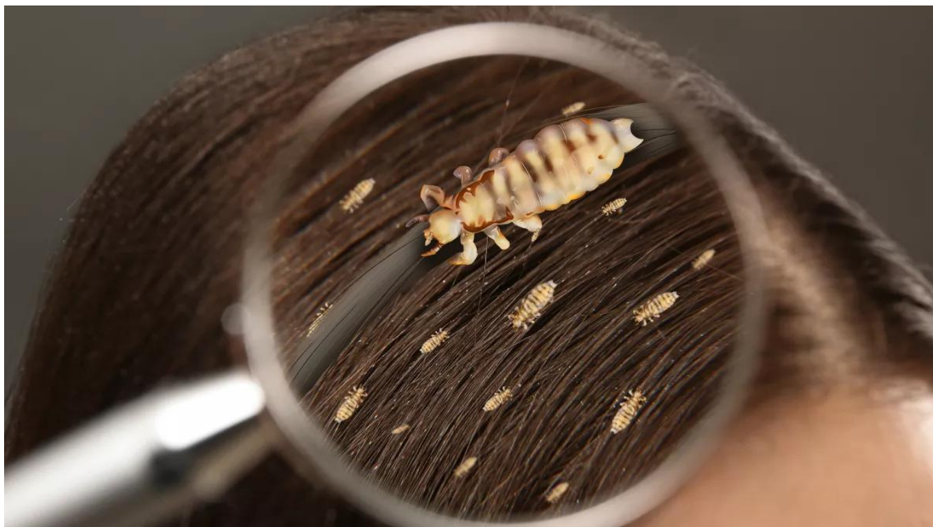
Ilustrasi kutu di rambut

Mencegah kutu lebih mudah daripada mengobatinya. Berikut beberapa tips yang bisa kamu lakukan: