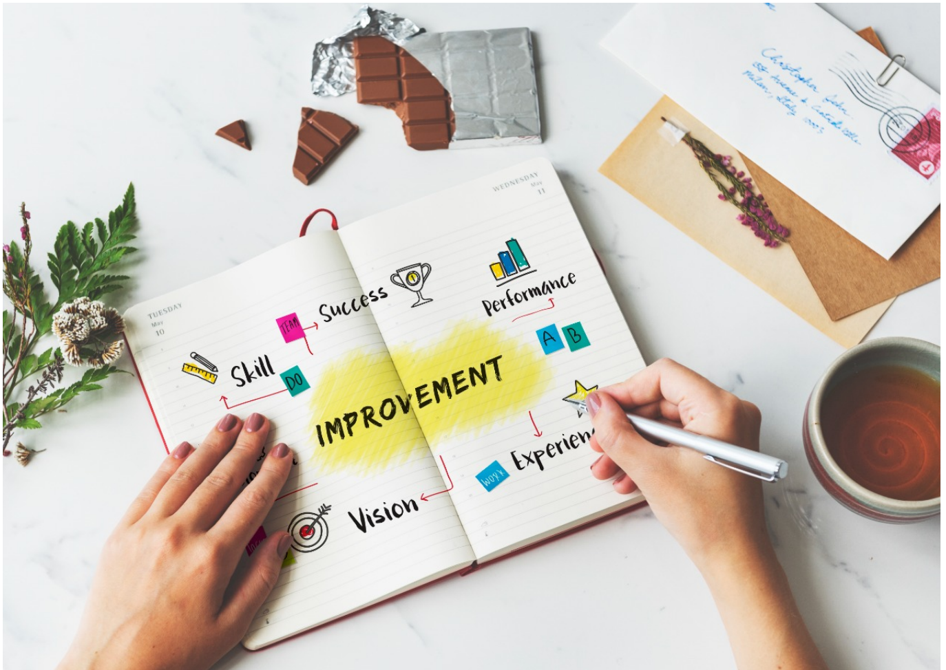
Balas dendam terbaik : Self Improvement

Jika kamu siap untuk menjadikan pertumbuhan diri sebagai prioritas, berikut beberapa langkah yang bisa kamu coba: