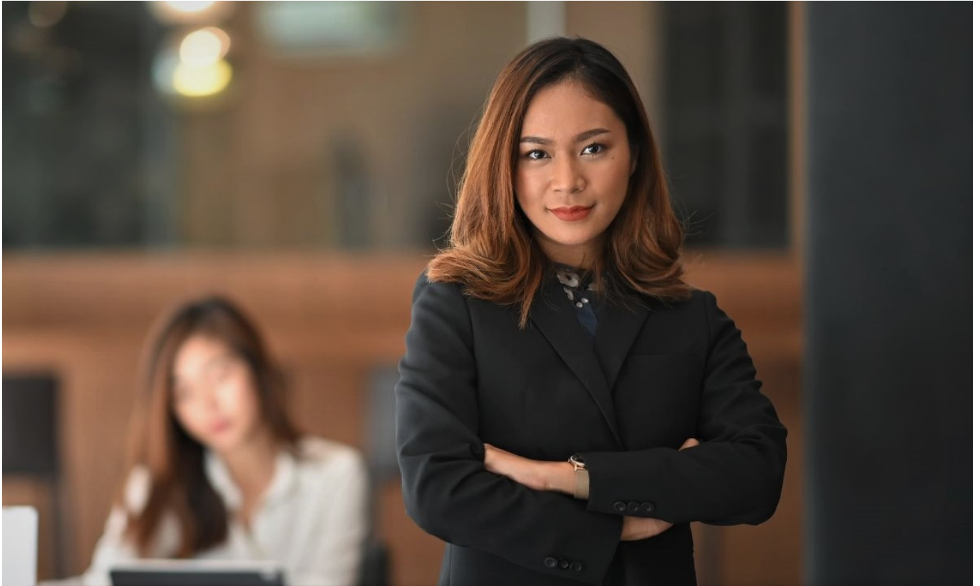
Balas dendam terbaik : Mencapai kesuksesan

Membangun kehidupan yang lebih baik, lebih sukses, dan lebih bahagia adalah bentuk balas dendam yang jauh lebih efektif.