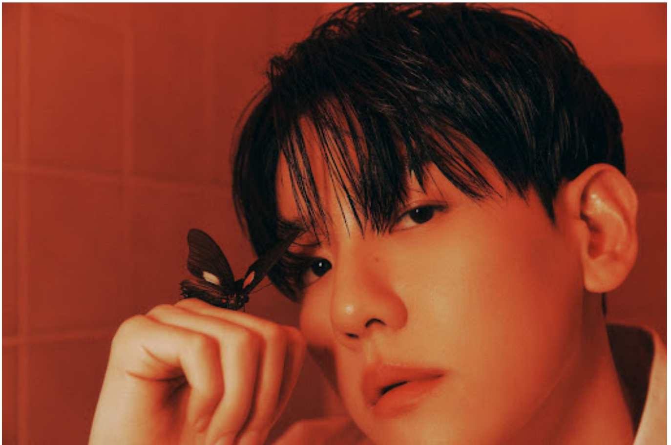
Baekhyun EXO

Para penggemar antusias menantikan perilisan mini album “Hello, World” dan penampilan yang akan disajikan oleh Baekhyun.