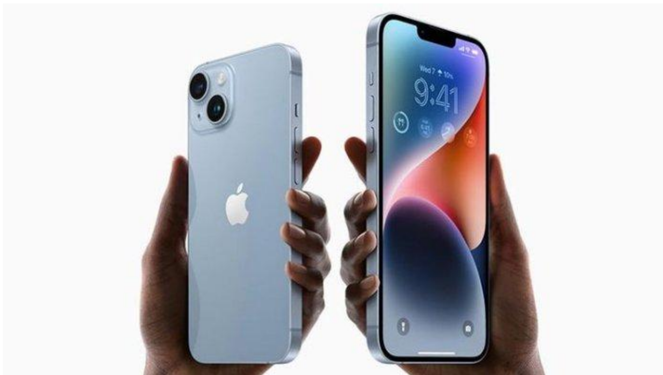
iPhone 15 dan iPhone 15 Plus – Kompas

Dalam pembaruan ini, Apple memberikan penjelasan yang lebih mendalam tentang apa yang diharapkan pengguna akan alami ketika mereka memilih untuk mengaktifkan pengaturan ini.