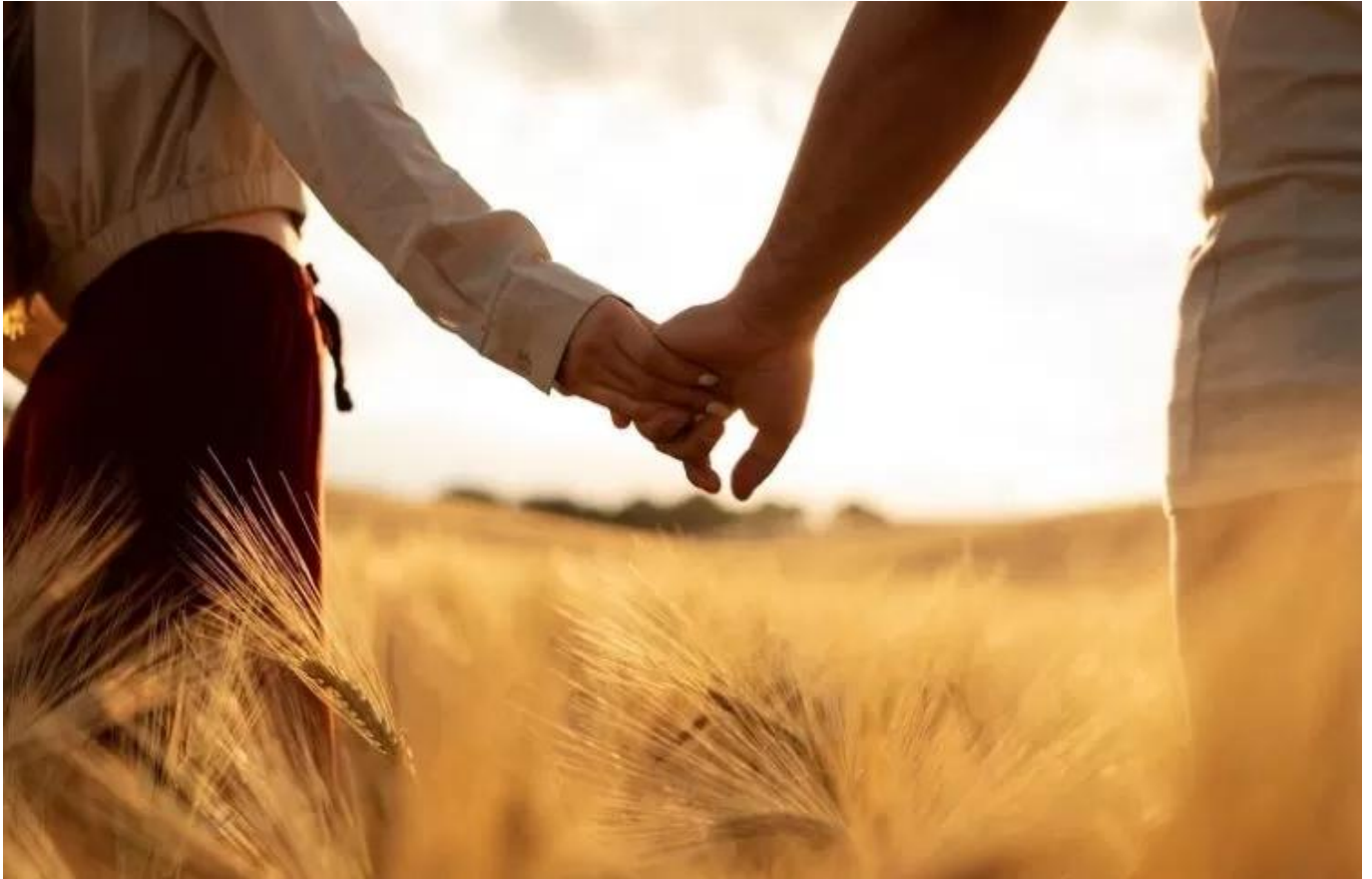
Ilustrasi pasangan

Banyak yang meyakini bahwa twin flame adalah satu-satunya pasangan yang ditakdirkan untuk bersama selamanya. Namun, tidak semua twin flame akhirnya bersatu dalam hubungan romantis.