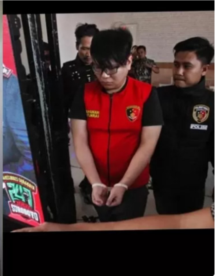
Instagram Lambe Danu