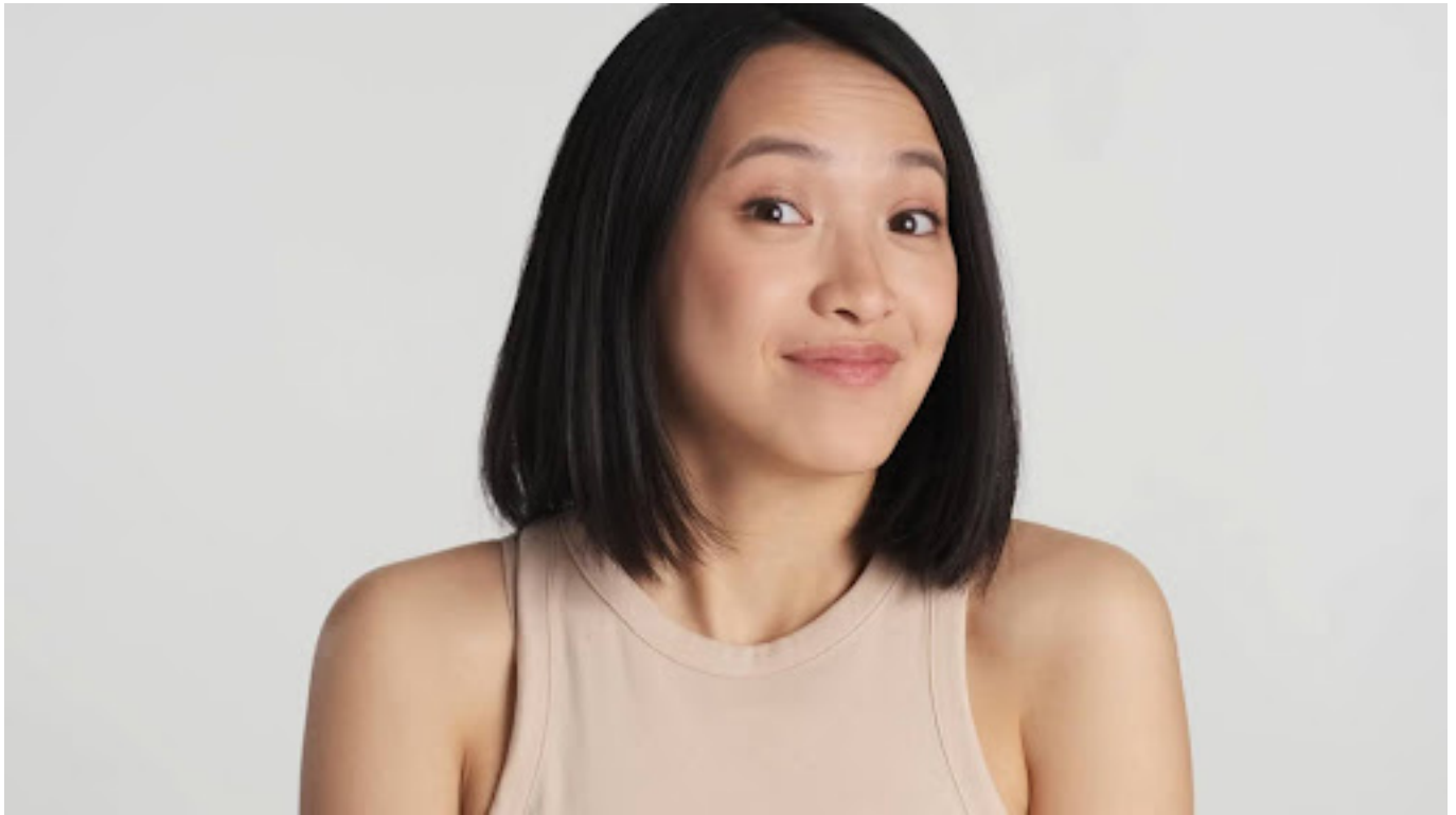
Ilustrasi wanita yang sehat

Ingatlah bahwa white discharge ini adalah hal yang normal dan alami pada wanita. Namun, jika kamu mengalami perubahan pada keputihan yang disertai dengan gejala lain seperti bau yang tidak sedap, perubahan warna atau tekstur, atau rasa gatal atau terbakar, sebaiknya segera konsultasikan ke dokter ya.