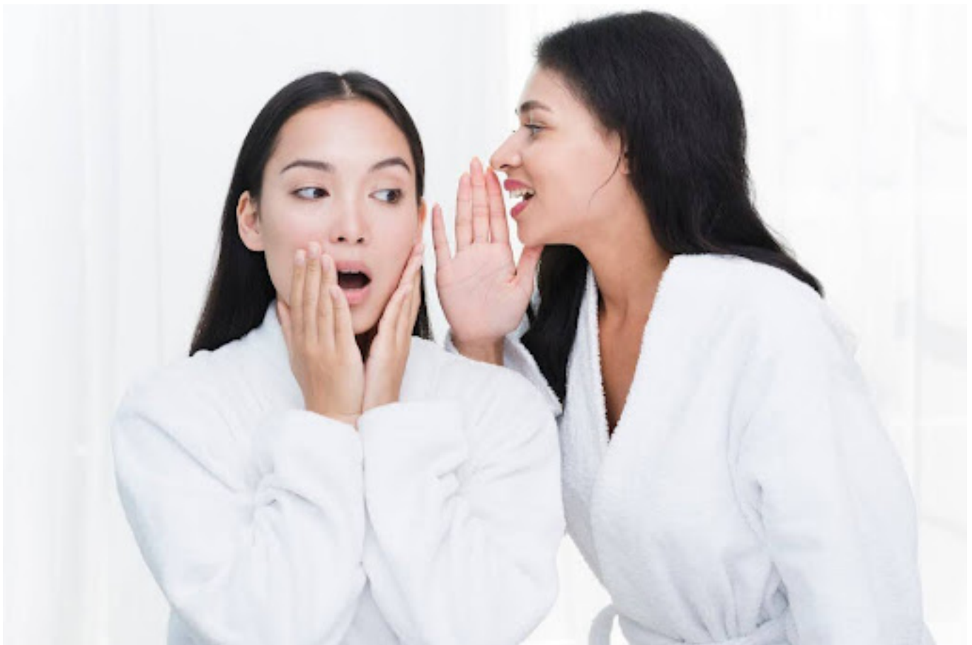
Ilustrasi dua wanita yang berbagi rahasia

Keputihan adalah hal yang normal dan alami pada wanita. Tapi, tahukah kamu bahwa perubahan pada keputihan dapat menjadi tanda kondisi kesehatanmu?