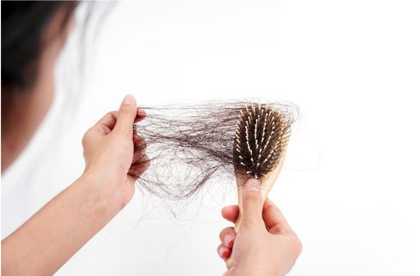
Ilustrasi rambut yang rusak dan rontok

Banyak faktor yang bisa menyebabkan rambut rontok, mulai dari faktor internal hingga eksternal: