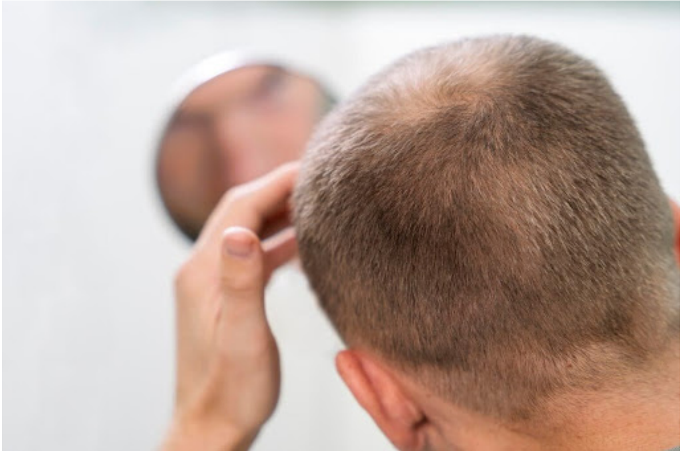
ilustrasi pria yang mengalami kebotakan rambut

Gejalanya bisa berbeda-beda, tergantung penyebabnya. Tapi, secara umum, rambut yang rontok bisa ditandai dengan: