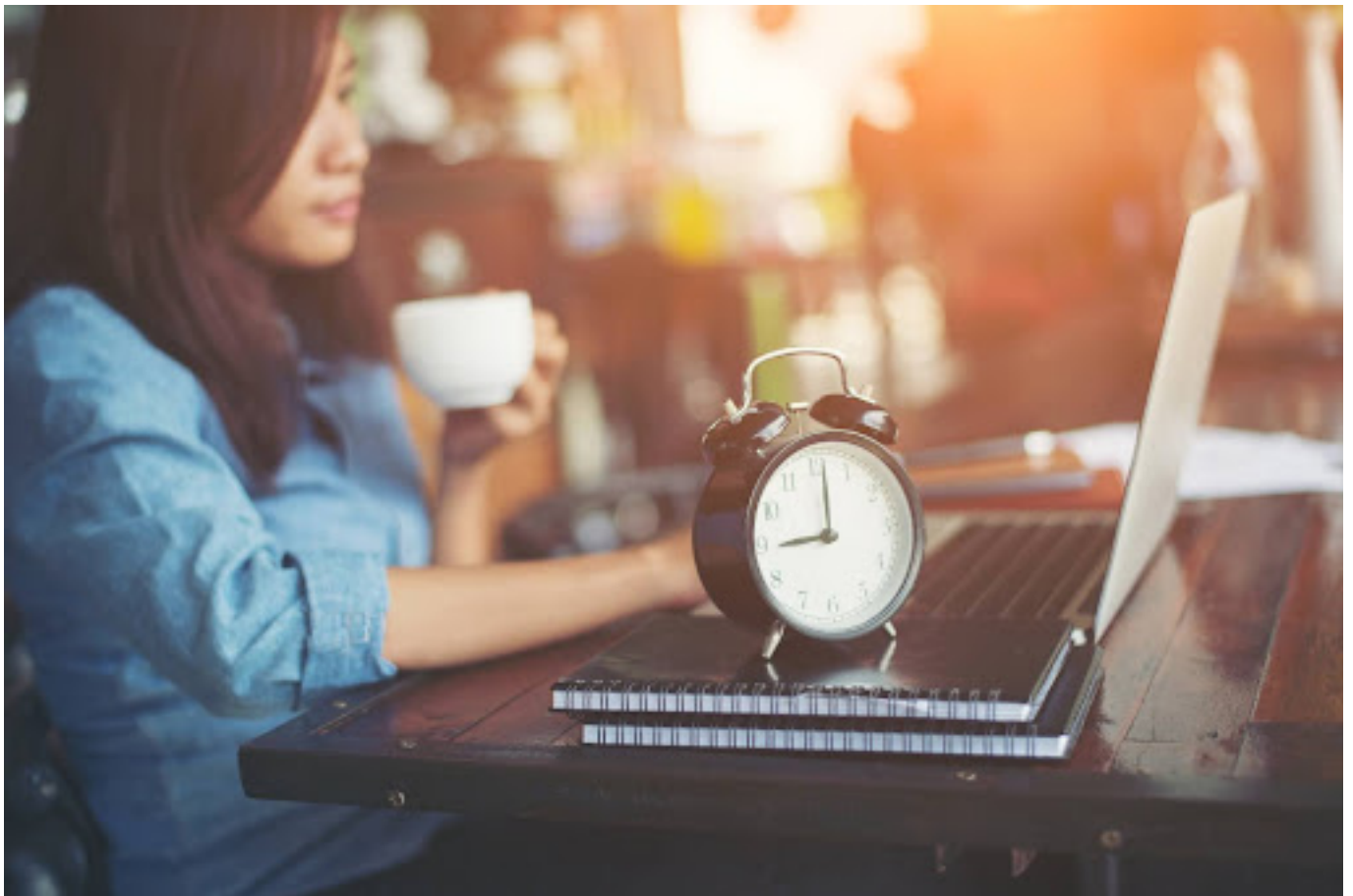
Ilustrasi wanita yang bekerja

Secara teratur tinjau cara kamu mengelola waktu. Identifikasi bagian yang perlu perbaikan dan sesuaikan strategi manajemen waktu sesuai kebutuhan.