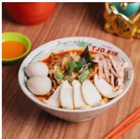
Bakmie Tjo Kin

Terletak di kawasan ikonik Jalan Braga, kedai ini menjadi salah satu destinasi kuliner favorit wisatawan.