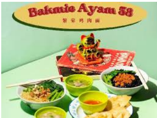
Bakmie Ayam 58

Mengusung konsep modern dan minimalis, tempat ini cocok bagi pengunjung yang