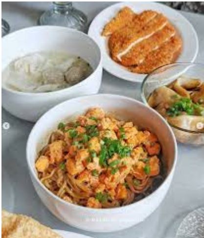
Bakmi Pelita 2

Terletak di dalam Gang Pelita II di Jalan KH Mustofa, kedai ini menawarkan suasana asri dengan konsep rumah tinggal.