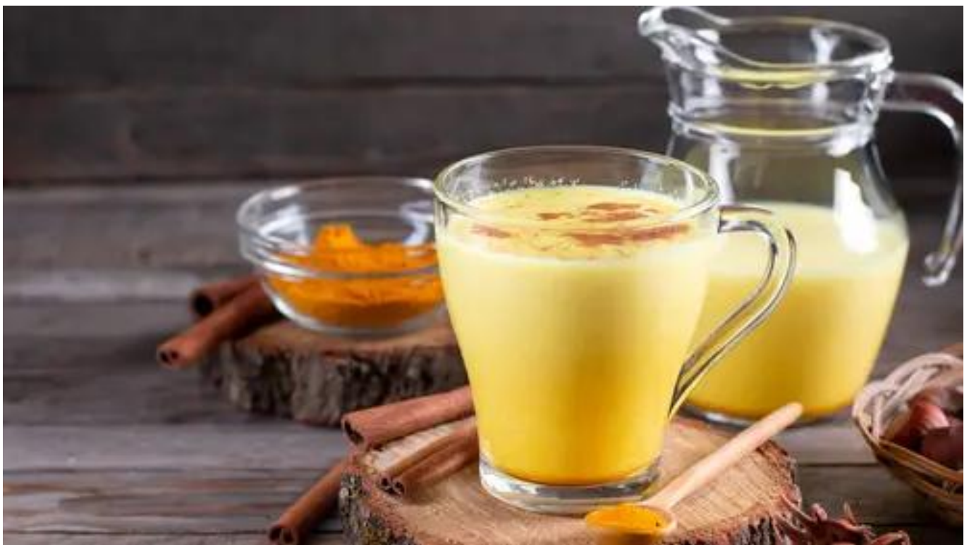
Kunyit dan susu hangat