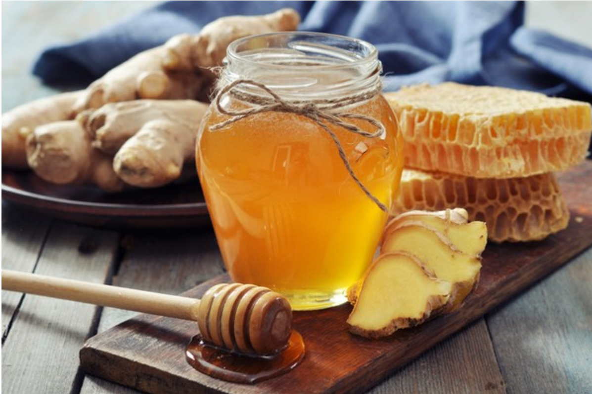
Ramuan jahe dan madu

Jahe memang sudah terkenal banget sebagai bahan yang ampuh meredakan batuk dan pilek. Rasa pedas dari jahe bisa membantu menghangatkan tenggorokan, meredakan dahak, serta memperlancar pernapasan. Madu, yang punya sifat antimikroba dan antiinflamasi, adalah pasangan sempurna buat jahe.