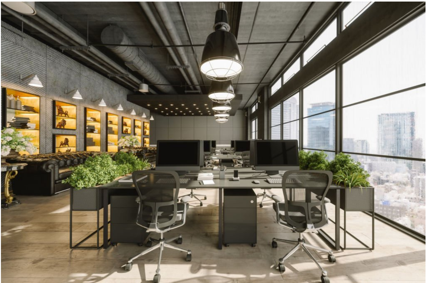
Workplace Well-Being – blkp