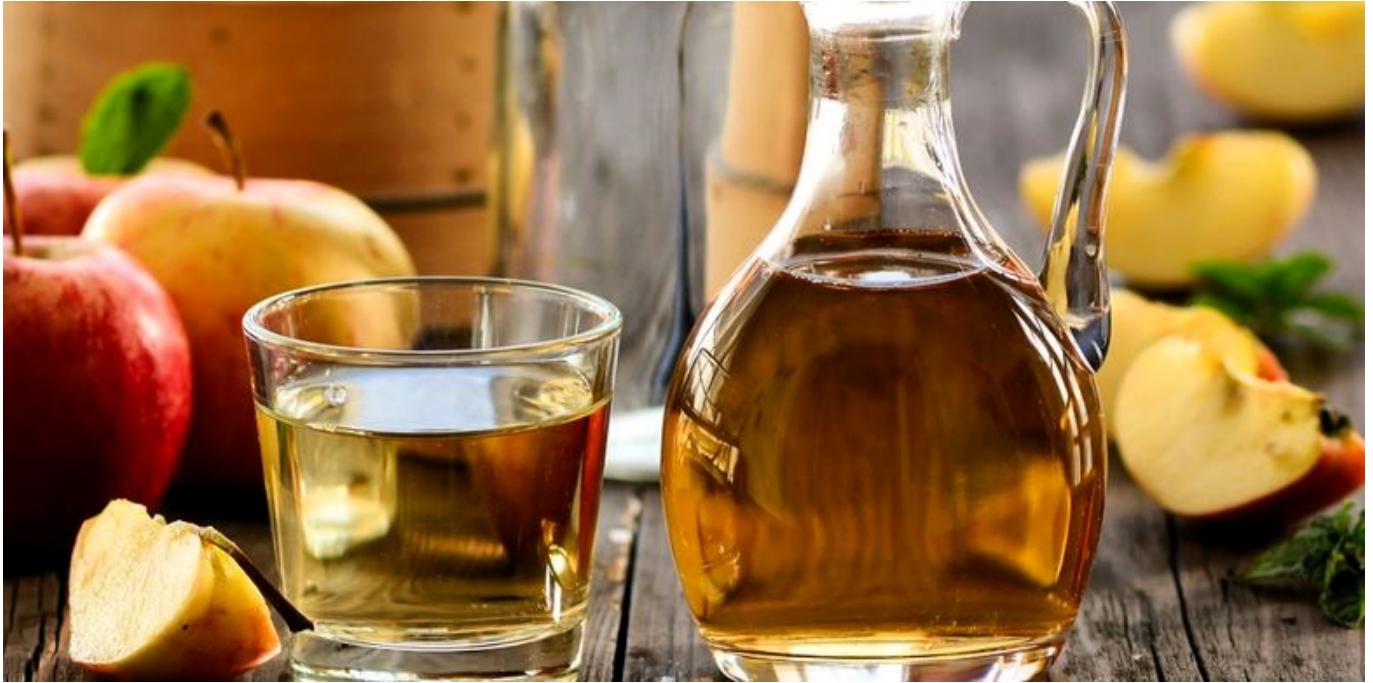
Cuka sari apel

Nah, teman-teman, untuk manfaat yang maksimal, gimana sih cara minum cuka apel ini? Jangan khawatir, gak usah minum langsung dari botolnya!