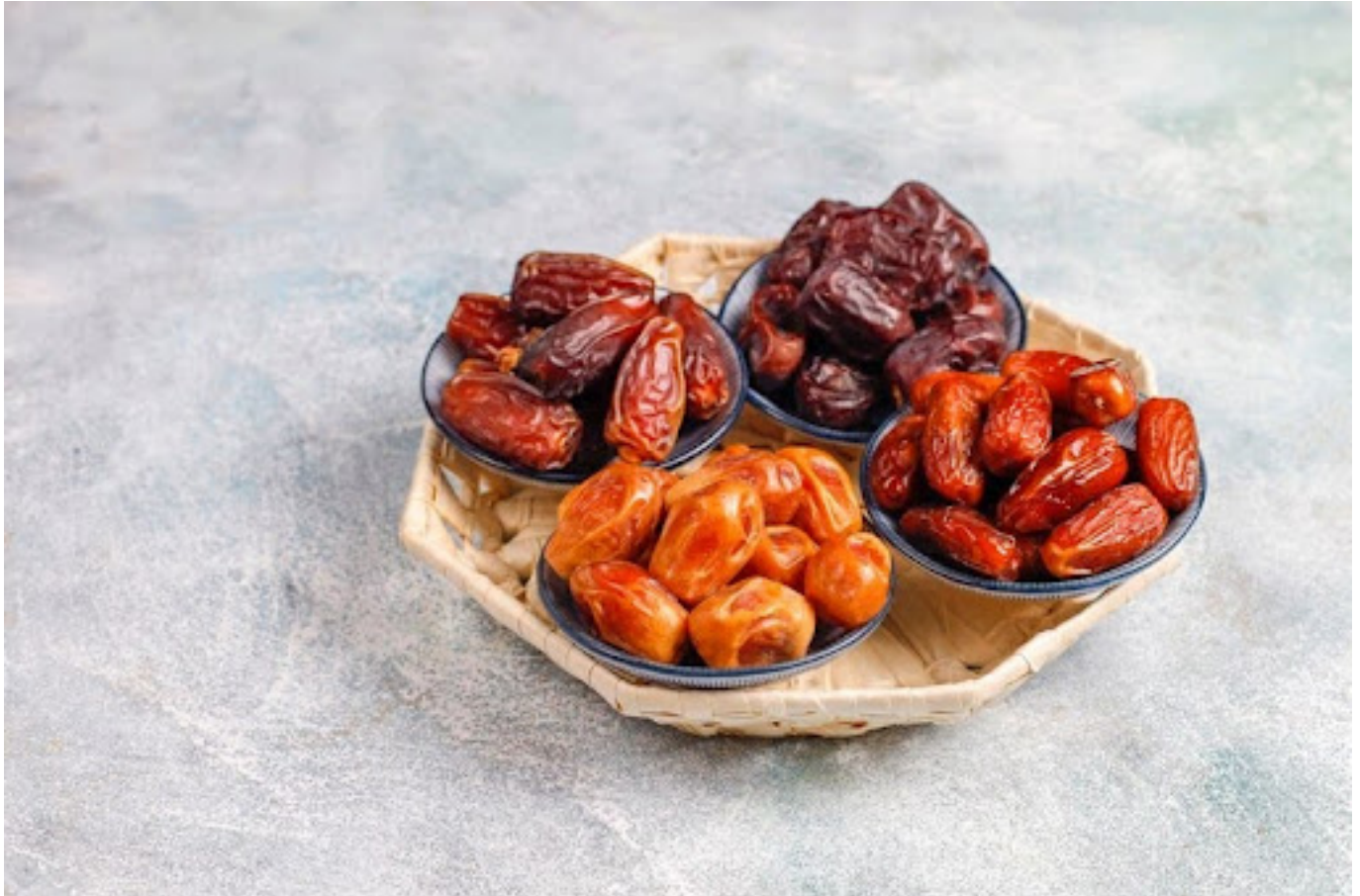
Ilustrasi berbagai macam buah kurma