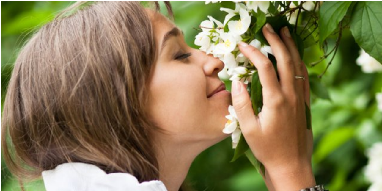
ilustrasi - dream

Jadi, buat yang lagi ngejar bentuk tubuh yang lebih fit, minum teh bunga melati bisa jadi pilihan yang oke nih. Rasanya enak, manfaatnya juga bikin tubuh jadi lebih fit dan bugar.