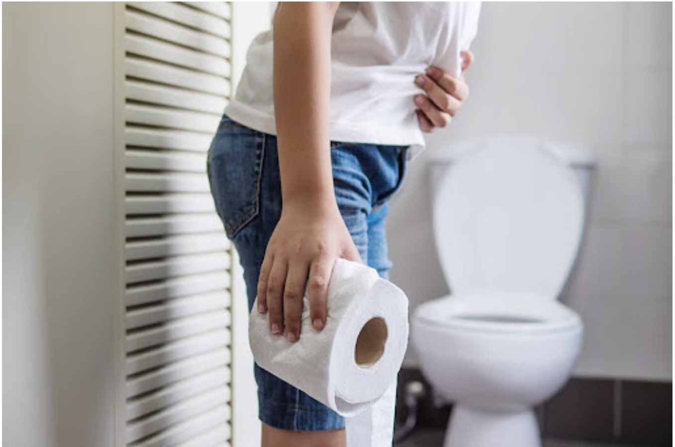
Ilustrasi anak laki-laki yang memegang perut di toilet

Sembelit terjadi ketika frekuensi buang air besar berkurang atau tinja menjadi keras dan sulit dikeluarkan.