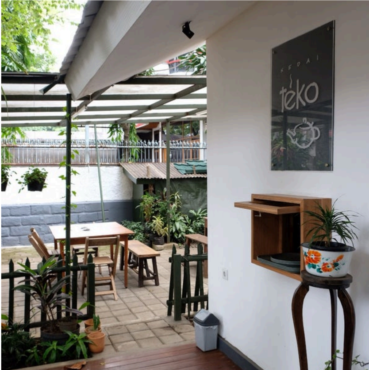
Kozi Coffee x Kedai Teko