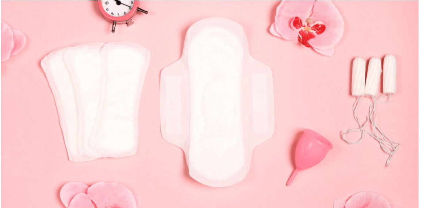
Macam macaam alat tampung darah

Mencari alat tampung menstruasi yang tepat bisa jadi tantangan, tapi dengan beberapa tips ini, kamu bisa lebih mudah memilih yang sesuai: