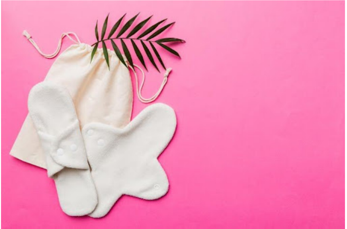
ilustrasi pembalut kain - freepik