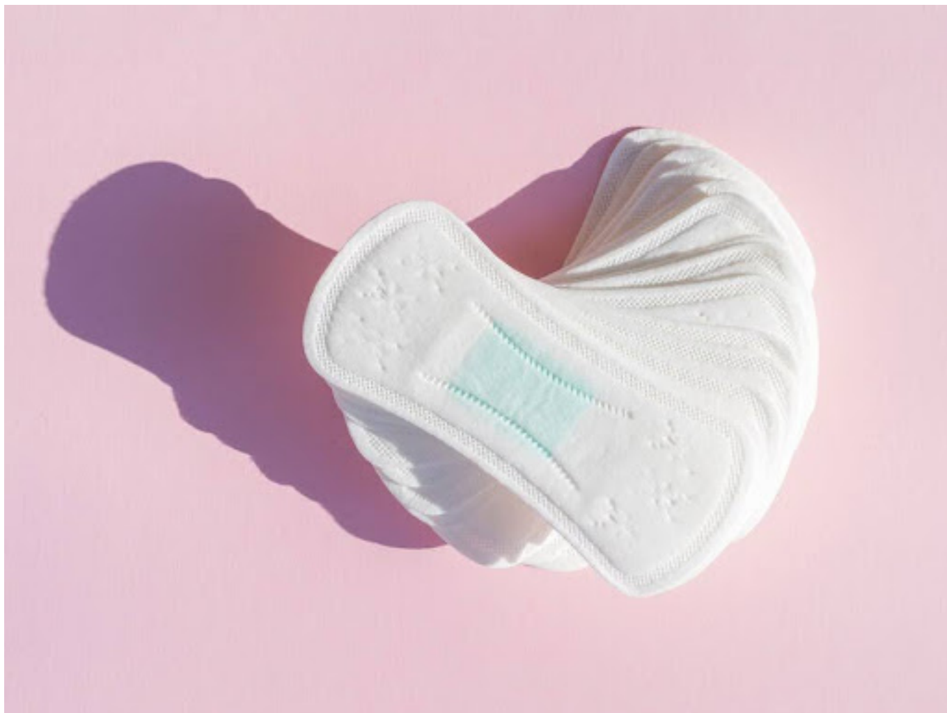
ilustrasi pembalut