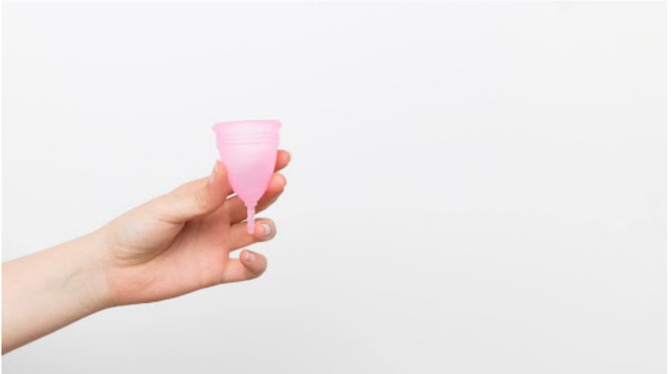
ilustrasi menstrual cup