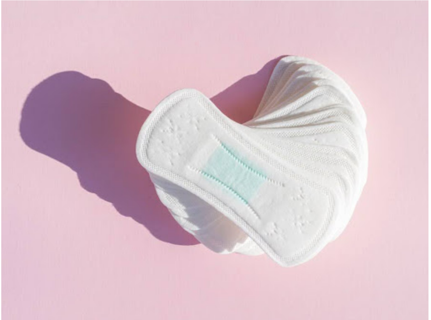
ilustrasi pembalut