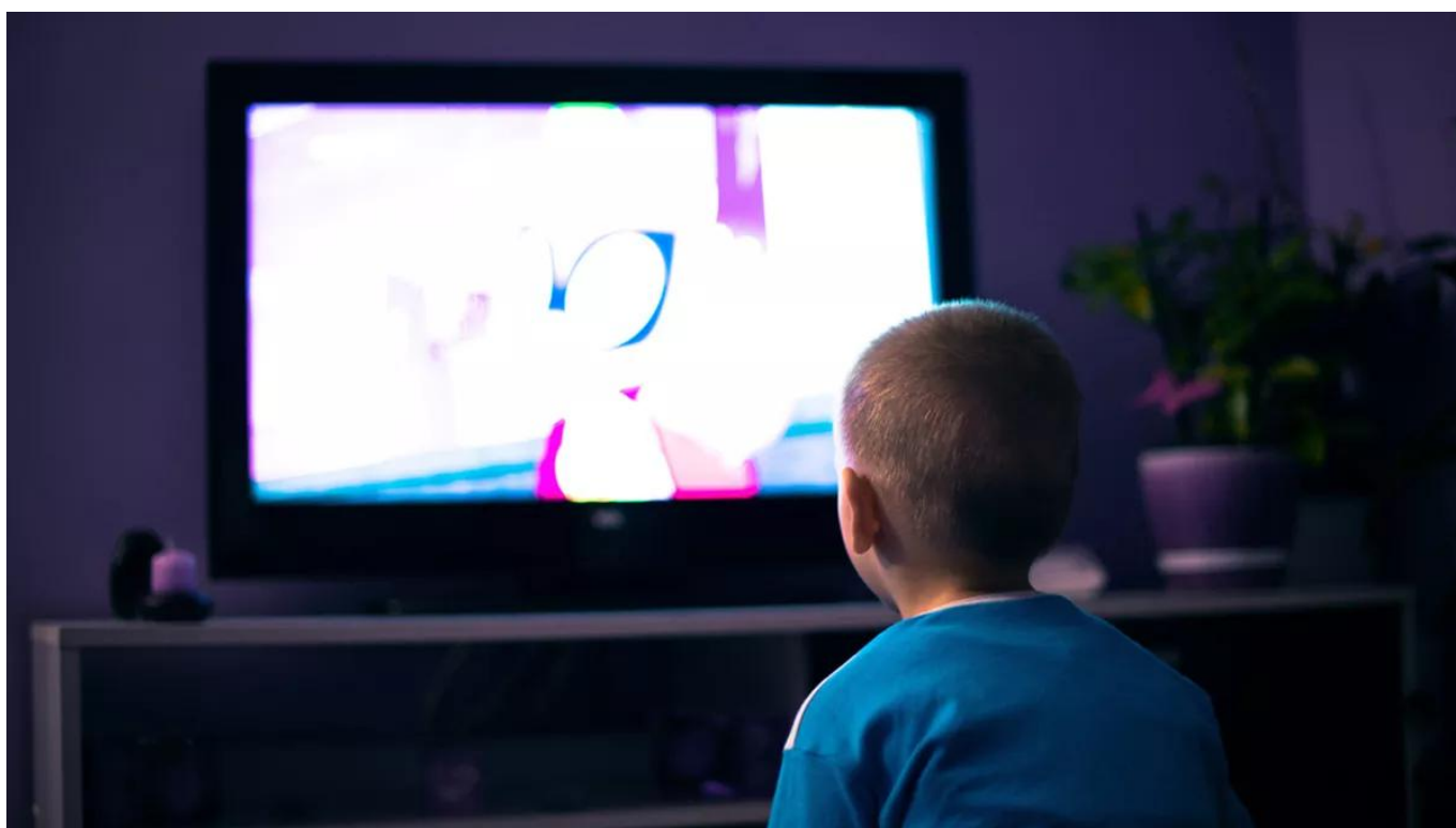
Ilustrasi anak menonton tv

Baca Juga: Badut Gendong: Teror Duka Paling Kelam di Qodrat Universe yang Bikin Penonton Tidak Nyaman