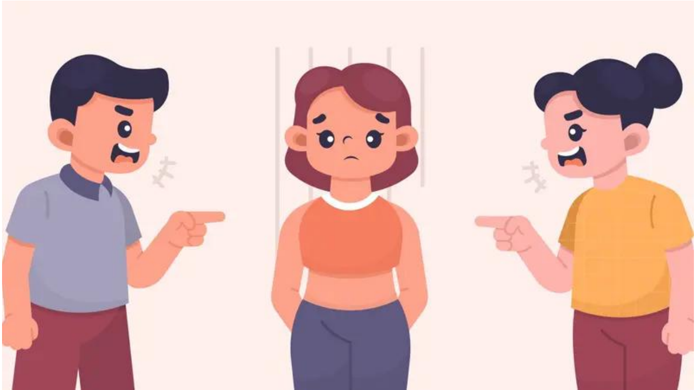
Ilustrasi Body Shaming

Menurut Oxford dictionary, body shaming adalah mengolok-olok, merendahkan, atau menjelekkan seseorang berdasarkan pandangan tentang kekurangan atau ketidaksempurnaan dalam penampilan fisik seseorang.