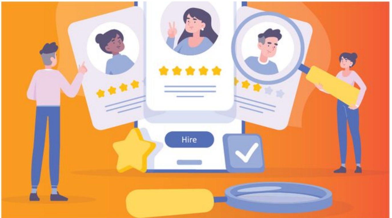
Ilustrasi - Freepik

Memperlakukan seseorang secara tidak adil berdasarkan penampilannya, seperti memberikan kesempatan pekerjaan atau sosial hanya kepada orang yang lebih “menarik secara fisik”, adalah bentuk diskriminasi yang sangat tidak pantas.