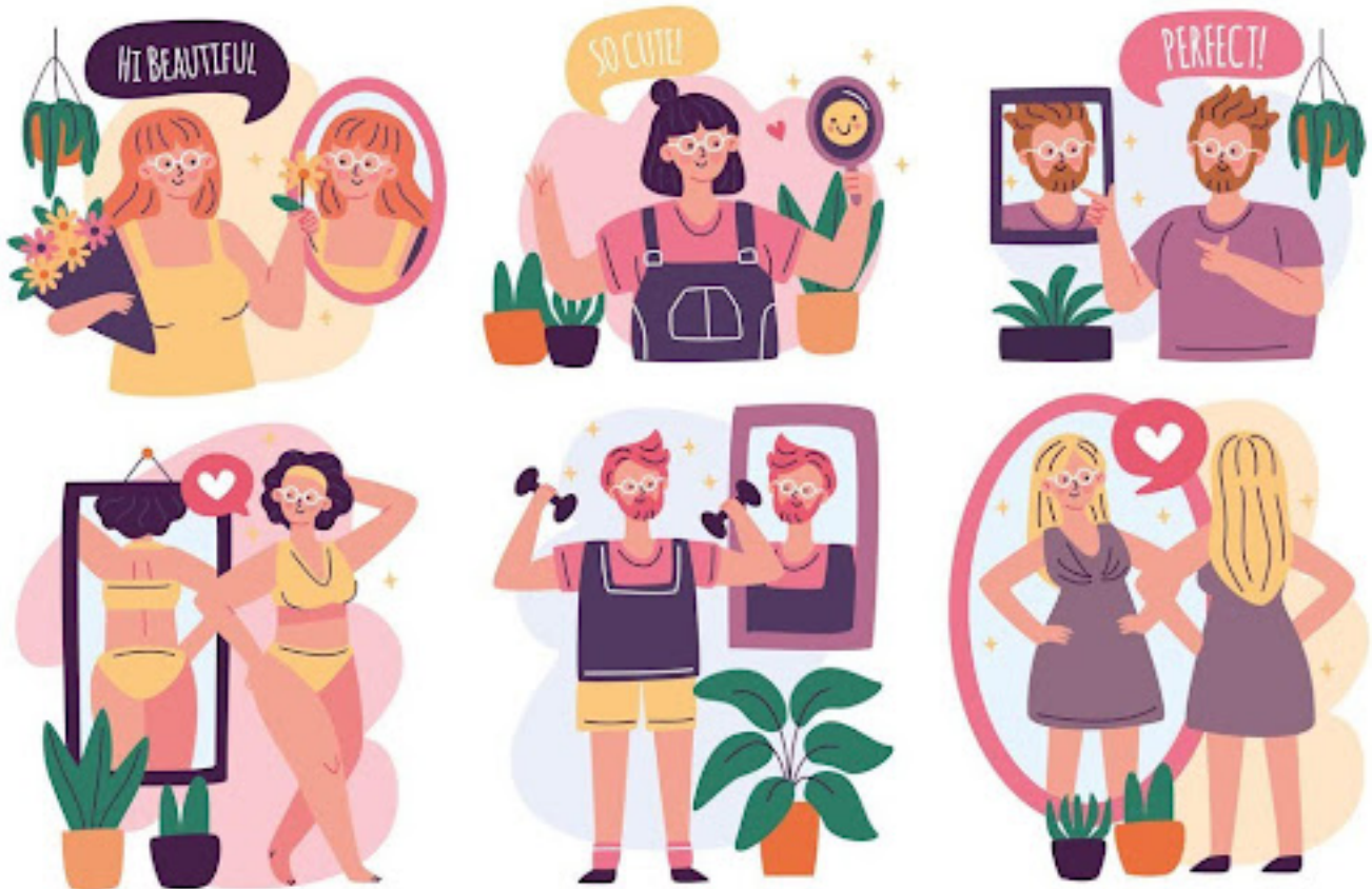
Ilustrasi - Freepik

Sebagai gantinya, penting untuk mempromosikan keberagaman dalam penampilan dan menghargai setiap jenis tubuh serta menekankan pada kecantikan yang bervariasi dan alami.