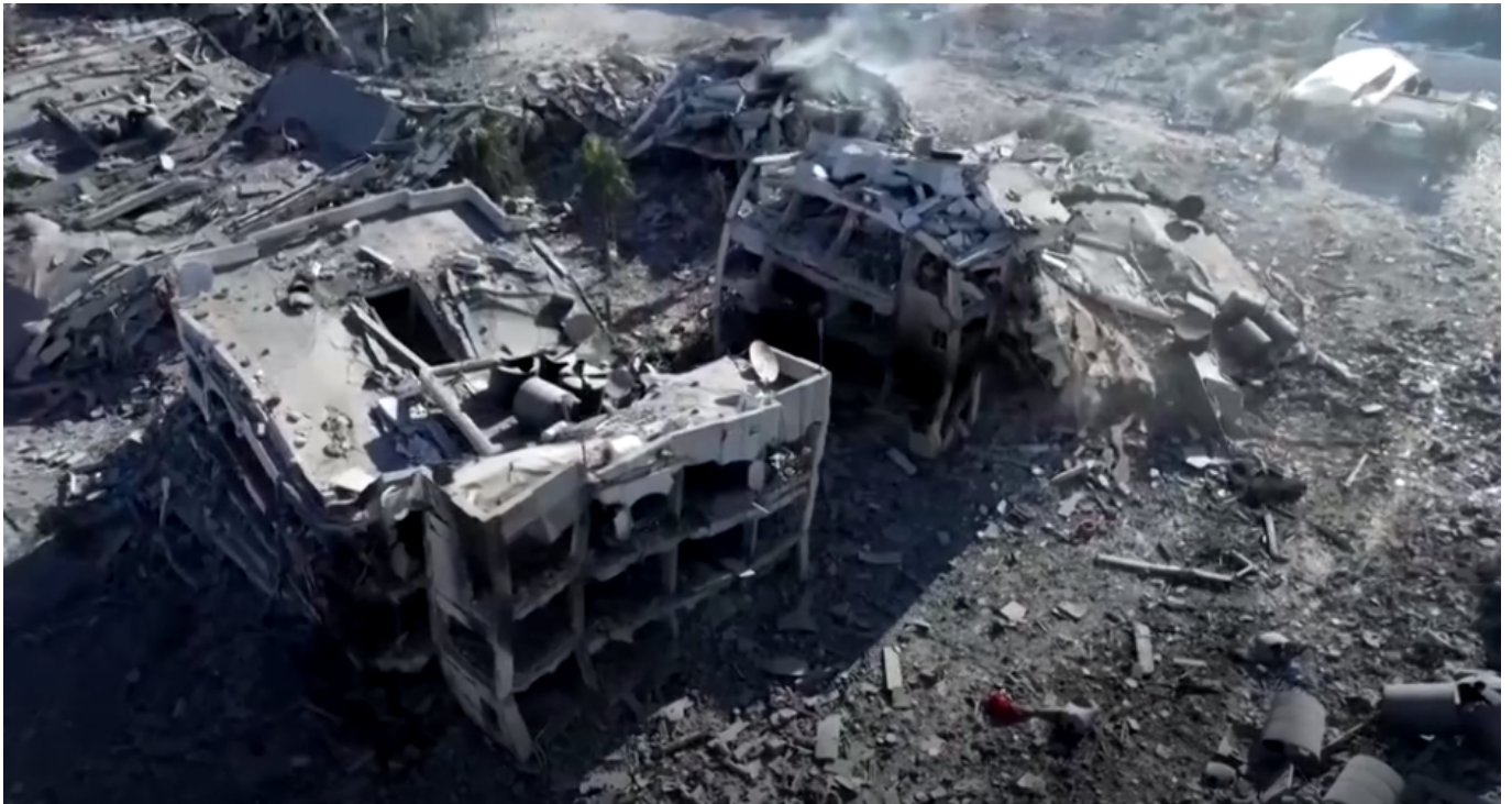
Gambaran puing-puing setelah serangan udara Israel menghantam bangunan

Pihak PBB menyatakan bahwa setidaknya diperlukan 100 truk setiap hari. Sebelum pecahnya konflik, rata-rata sekitar 450 truk bantuan tiba di Gaza setiap hari.