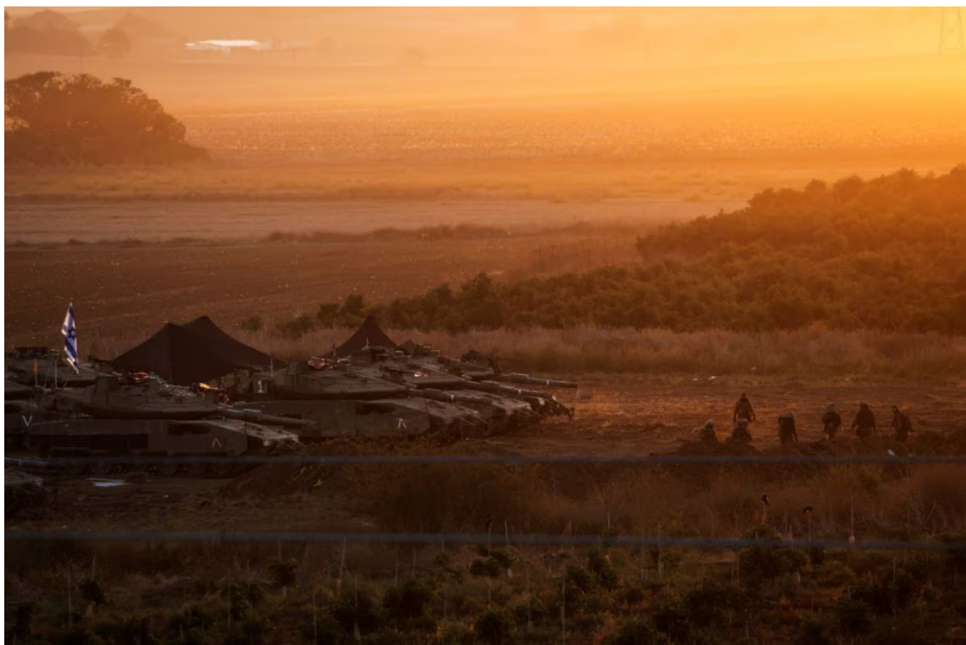
Formasi tank-tank Israel diposisikan di dekat perbatasan Israel dengan Jalur Gaza - Violeta Santos Moura

Israel telah mengumpulkan tank dan pasukan di dekat perbatasan yang terpagar di sekitar daerah pesisir sempit tersebut untuk invasi darat yang direncanakan dengan tujuan memusnahkan Hamis.