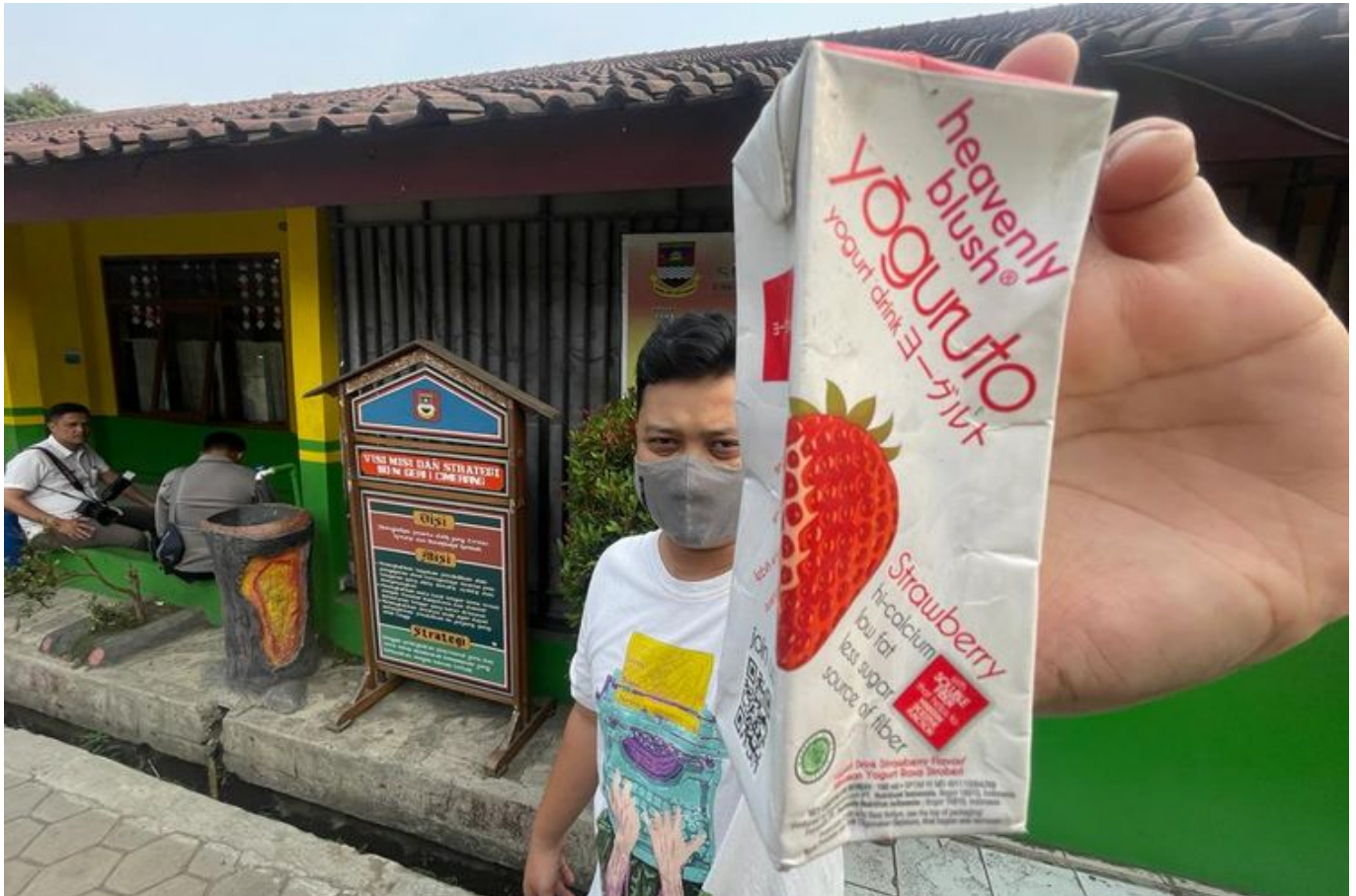
20 Siswa SDN 1 dan 2 Cimerang di KBB keracunan minuman yoghurt.

Puluhan siswa diduga mengonsumsi yoghurt yang dibelinya di lingkungan sekolah. Sebelumnya siswa SDN 1 dan 2 Cimerang merasakan pusing, mual dan muntah.