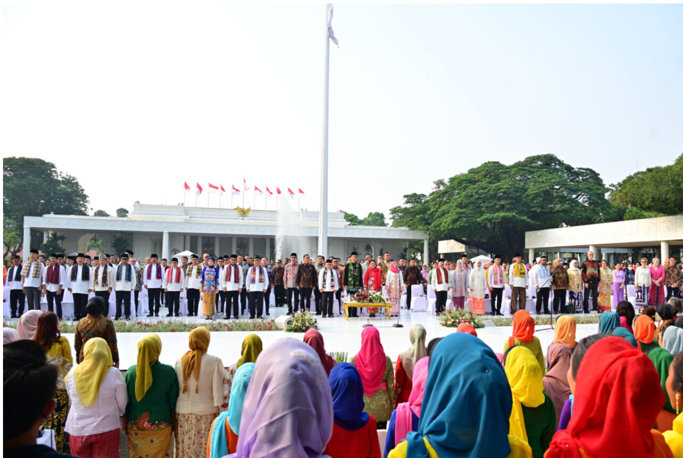
Istana Berkebaya

Rangkaian peringatan Hari Ulang Tahun (HUT) Kemerdekaan Republik Indonesia yang ke-78 sebenarnya telah dimulai sejak tanggal 6 Agustus lalu, dengan sebuah acara yang sangat istimewa, yaitu Istana Berkebaya.