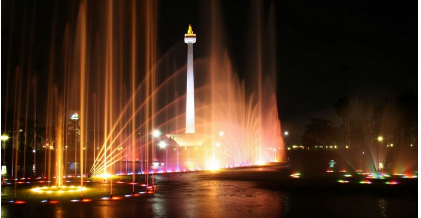
Kirana Nusantara

Selain berbagai hiburan yang sudah disebutkan, ada satu lagi atraksi yang tak boleh dilewatkan, yaitu acara Kirana Nusantara.