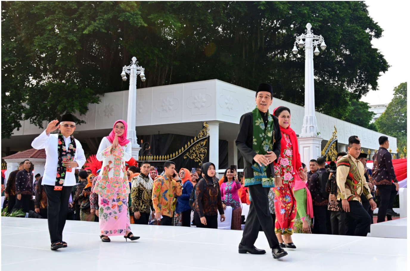
Istana Berkebaya

mengembangkan kreativitas mereka serta mempromosikan kekayaan budaya Indonesia, yang pada gilirannya juga akan berdampak positif terhadap sektor pariwisata dalam negeri.