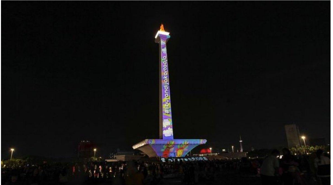
Video Mapping di Monas