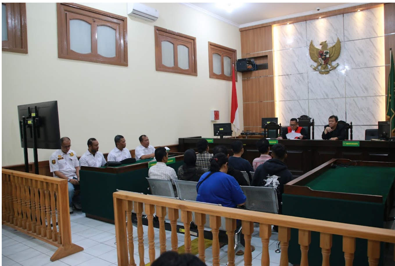
Diskominfo Kota Bandung

Para pelangat disidang setelah dijaring oleh Satuan Polisi Pamong Praja Kota Bandung karena diduga melanggar sejumlah aturan.