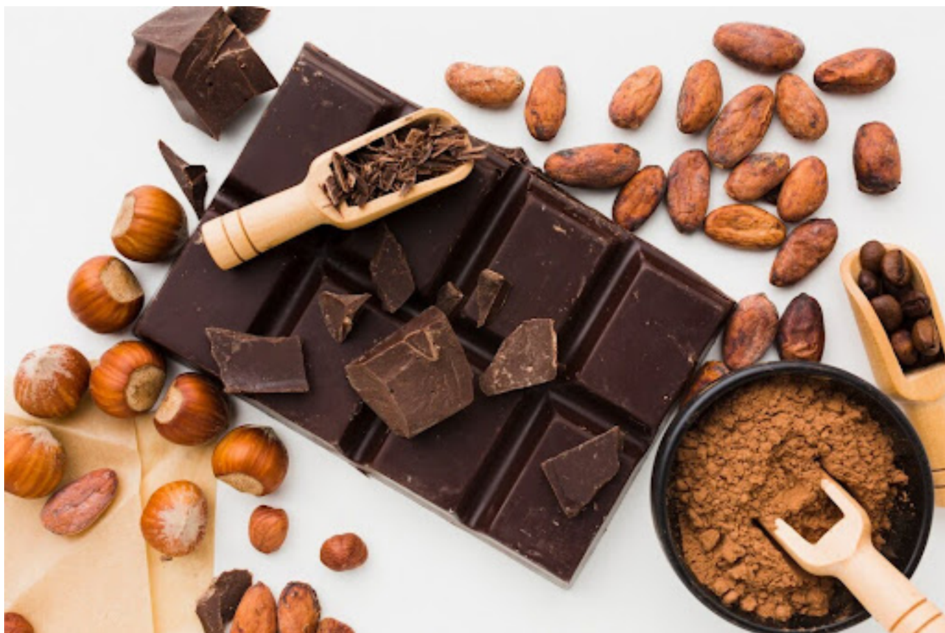
Manfaat cokelat