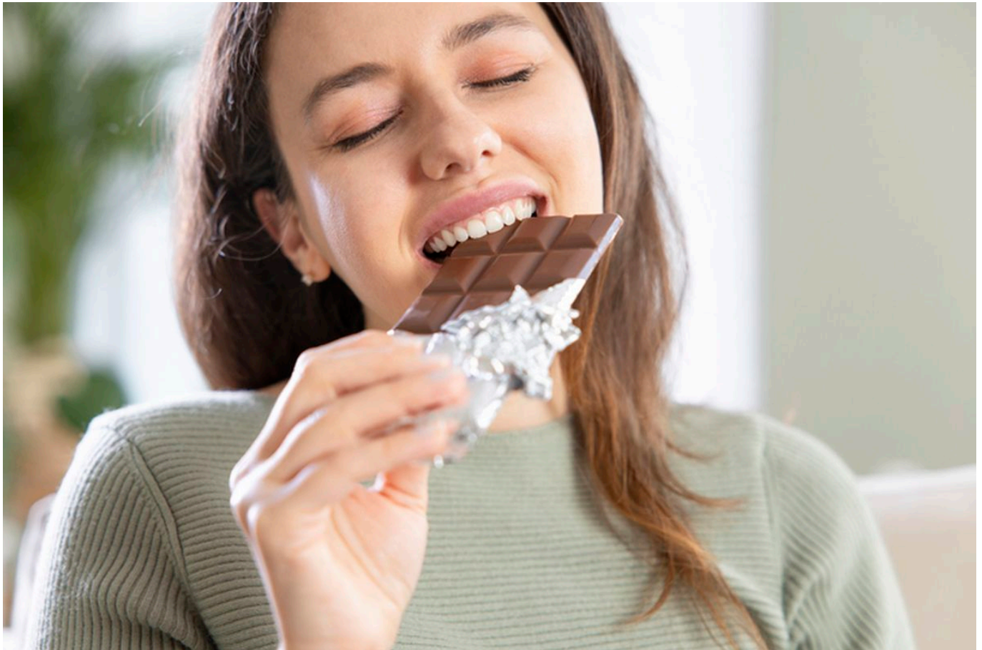
Makan cokelat - detikfood

Konsumsi cokelat bisa menimbulkan beberapa efek samping yang perlu diwaspadai, seperti alergi, reaksi terhadap susu, dan dampak kafein.